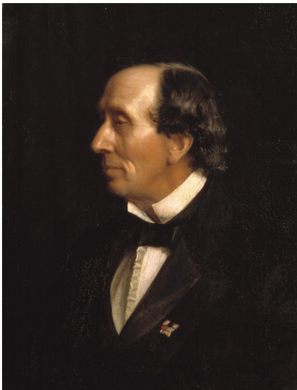
Portret Hansa Christiana Andersena

Danes je mednarodni dan knjig za otroke. Na ta dan se je leta 1805 na Danskem rodil Hans Christian Andersen. Že v otroških letih se je prepuščal sanjarjenju, želel je postati pesnik in igralec. Napisal je nekaj romanov in gledaliških iger, a z njimi ni zaslovel. Svetovno slavo so mu prinesle pravljice, ki so prevedene v veliko svetovnih jezikov. Hans Christian Andersen je eden najbolj znanih pisateljev na svetu.