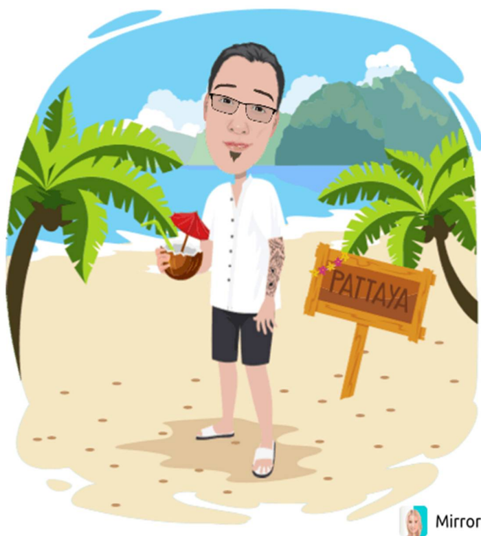
UČITELJ NA SAMOTNEM OTOKU