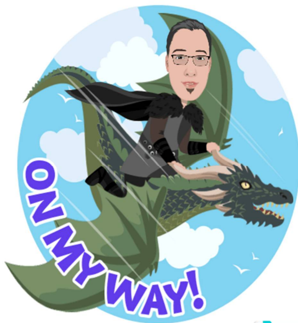
KAKO UČITELJ IZURI ZMAJA