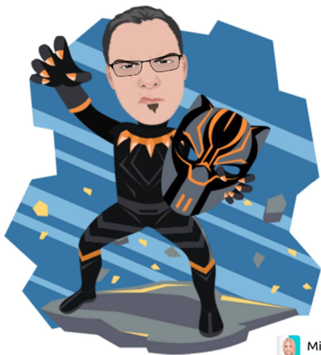
ČRNI MAČEK NA PATRULJI