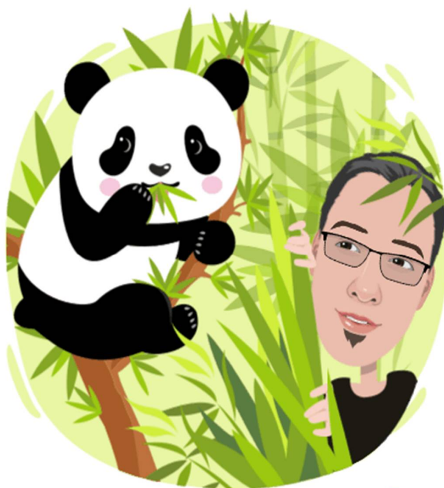
VAJENEC KUNG FU PANDE