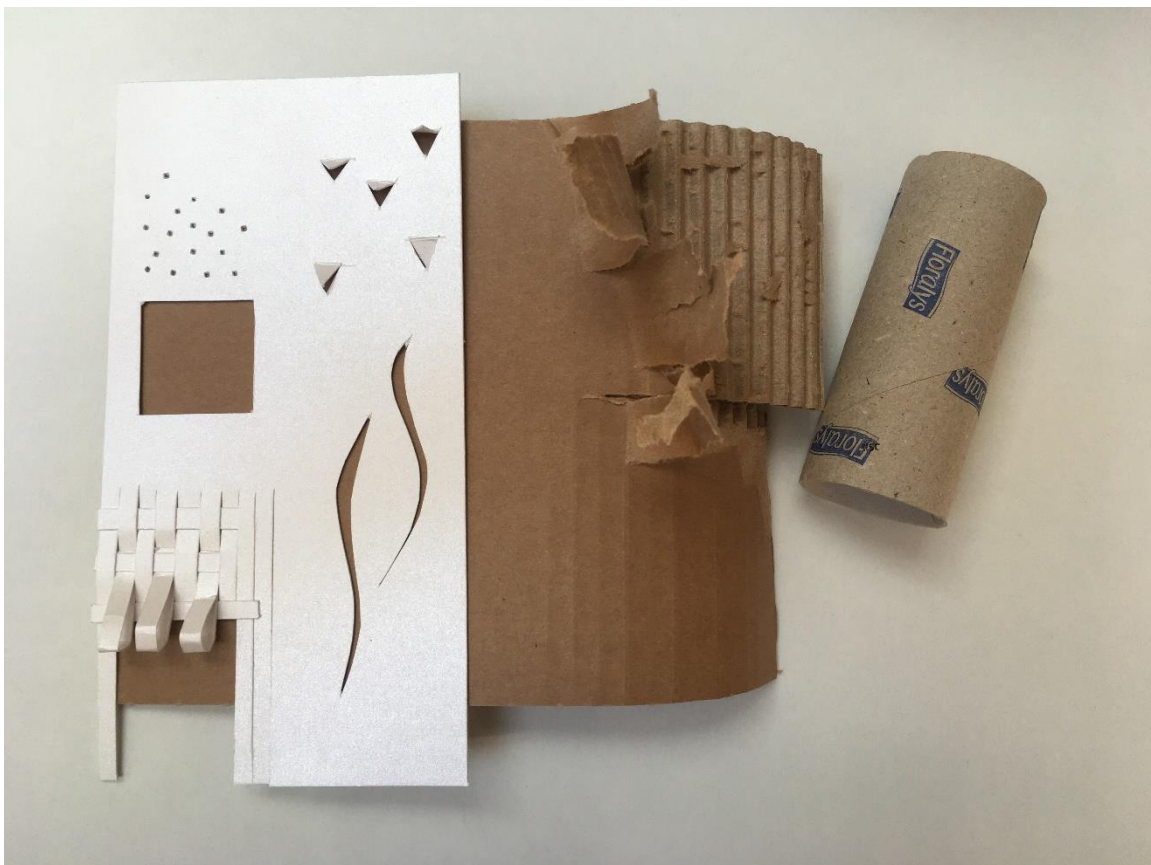
Načini oblikovanja stavbne lupine