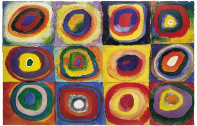
Wassily Kandinsky, 1913

Ritmično razvrščanje likovnih elementov je najbolj osnoven kompozicijski način.