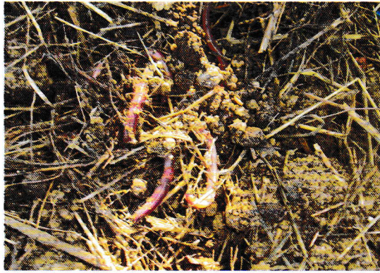
Slika 3: Deževniki so znak rodovitnosti zemlje.

Lastnosti prsti so kazalci abiotskih in biotskih dejavnikov, ker nastajajo s preperevanjem zgornjega trdega dela zemeljske skorje, ki se s preperevanjem in učinkovanjem rastlin in živali preobrazijo v rodovito plast. Pomemben člen v sooblikovanju lastnosti prsti je tudi človek, ki mnogostransko spreminja njihove naravne značilnosti.