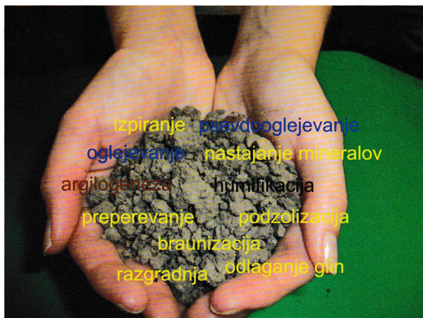
Slika 2: V prsti potekajo številni procesi brez prestanka, kar vpliva na rodovitnost prsti.

Proces tvorbe humusa iz organskih ostankov imenujemo humifikacija. Potek humifikacije spremlja mineralizacija, kjer se del odmrle organske snovi popolnoma razkroji na sestavne dele (CO 2 , H 2 O, NH 3 , H 2 S in druge elemente).