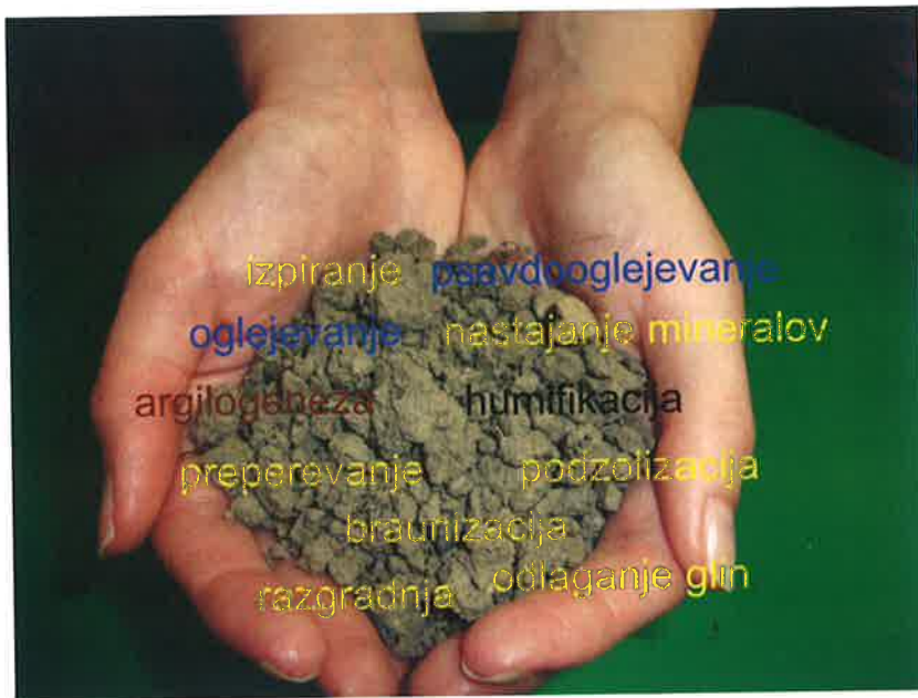
Slika 2: V prsti potekajo številni procesi brez prestanka, kar vpliva na rodovitnost prsti.

Proces tvorbe humusa iz organskih ostankov imenujemo humifikacija. Potek humifikacije spremlja mineralizacija, kjer se del odmrle organske snovi popolnoma razkroji na sestavne dele (CO 2 , H 2 O, NH 3 , H 2 S in druge elemente).