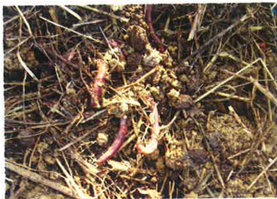
Slika 3: Deževniki so znak rodovitnosti zemlje.

Lastnosti prsti so kazalci abiotskih in biotskih dejavnikov, ker nastajajo s preperevanjem zgornjega trdega dela zemeljske skorje, ki se s preperevanjem in učinkovanjem rastlin in živali preobrazi v rodovitno plast. Pomemben člen v sooblikovanju lastnosti prsti je tudi človek, ki mnogostransko spreminja njihove naravne značilnosti.