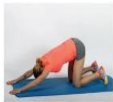
1 Raztezanje iztegova ramena.

Za raztezanje v sklepnem delu vadbe izberemo sledeče statične raztezne vaje.