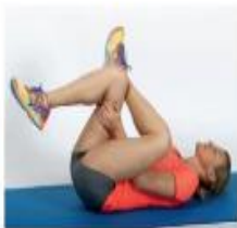
4 Raztezanje iztegova in odmikalk kolka.