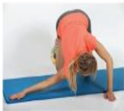
3 Raztezanje horizontalnih primikalk ramena.