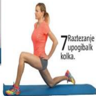
7 Raztezanje upogibalke kolka.