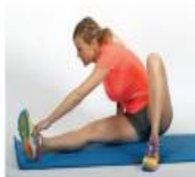
5 Raztezanje upogibalke kolena in odmikalke kolka.