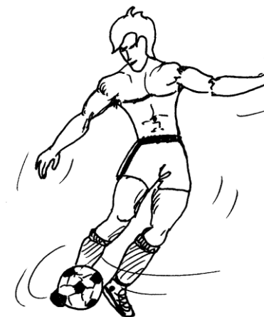
udarec s sprednjim notranjim stopala