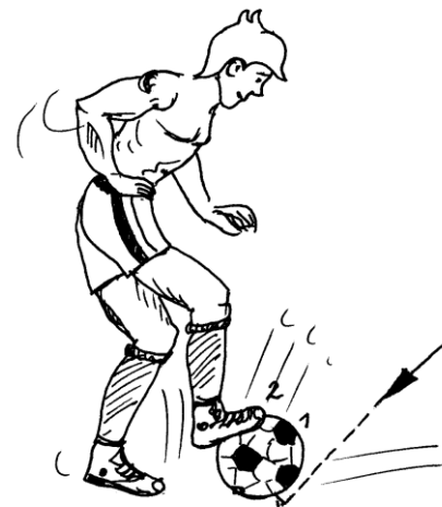
zaustavljanje s podplatom