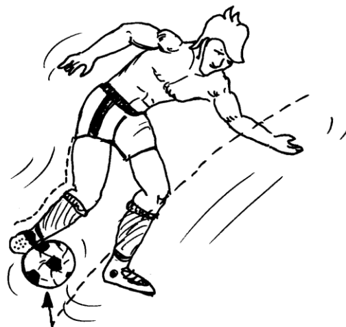
zaustavljanje z notranjim delom stopala