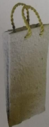
Voščilnica in darilna vrečka iz recikliranega papirja

Naredi vajo Voščilnica in darilna škatlica.