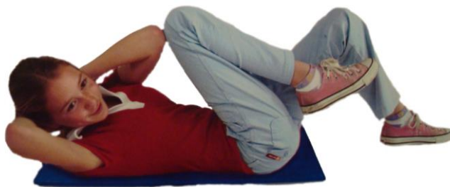
KRIŽNO GIBANJE SEDE BRAIN GYM®