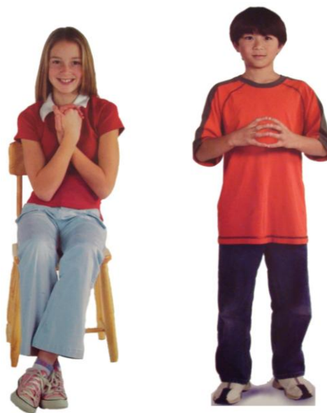
ZANKE BRAIN GYM®