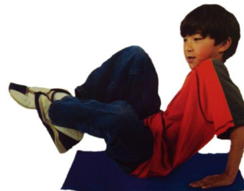
GUGALNICA BRAIN GYM®