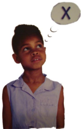
POMISLI NA X BRAIN GYM®