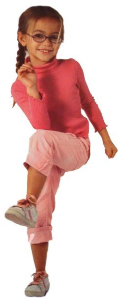
KRIŽNO GIBANJE BRAIN GYM®