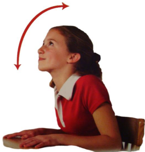
SPODBUJEVALEC BRAIN GYM®