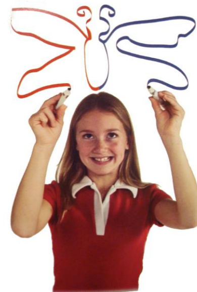
SIMETRIČNO RISANJE BRAIN GYM®