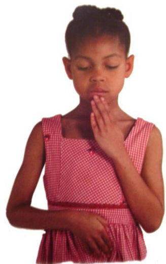
ZEMELJSKA GUMBKA BRAIN GYM®