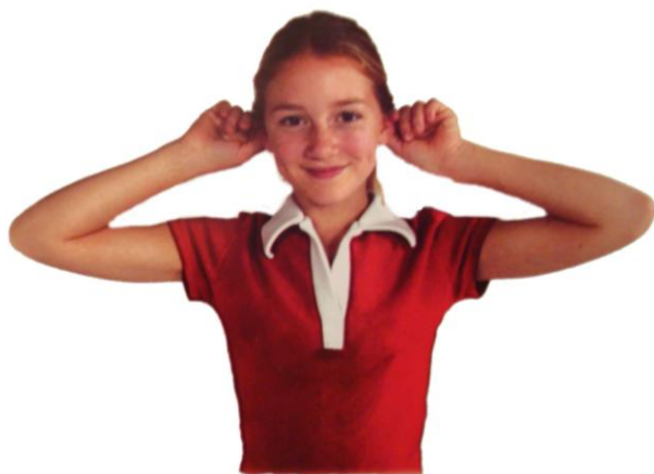
MISELNI GUMBKI BRAIN GYM®