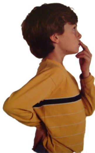
VESOLJSKA GUMBA BRAIN GYM®