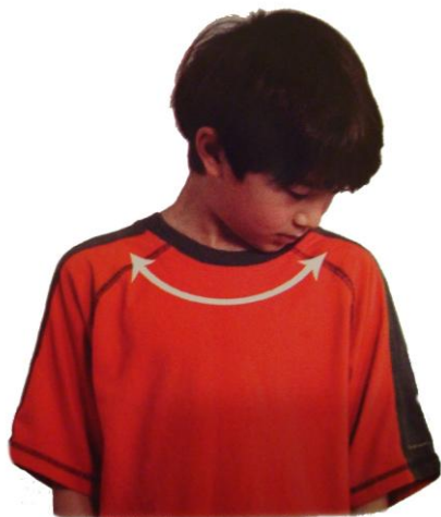
KOTALJENJE VRATU BRAIN GYM®