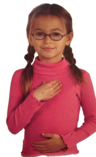
MOŽGANSKA GUMBKA BRAIN GYM®