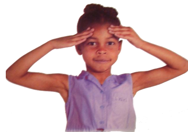
POZITIVNI TOČKI BRAIN GYM®