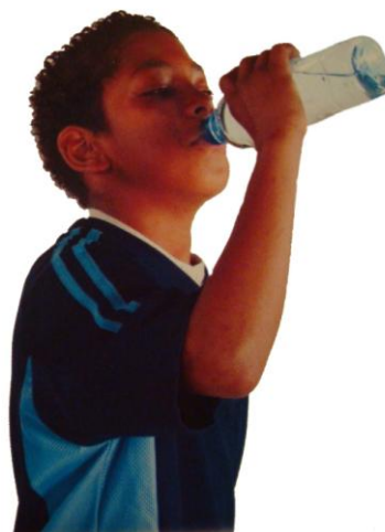
VODA BRAIN GYM®