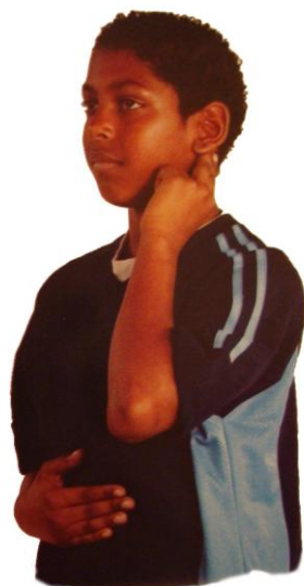
GUMBKA ZA RAVNOTEŽJE BRAIN GYM®