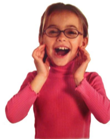
ENERGIJSKO ZEHANJE BRAIN GYM®