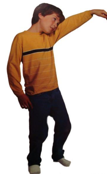
SLON BRAIN GYM®