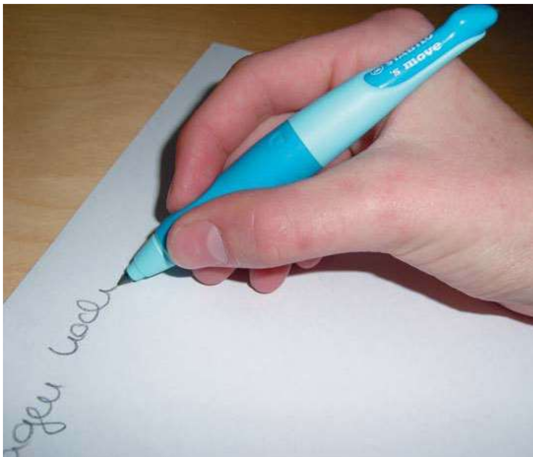
Pravilna drža pisala

Lepo držo pisala lahko ponazorimo tako, da otroku najprej naročimo, naj roko položi na mizo v položaj, ki je podoben pisanju. Vsi sklepi sedaj sproščeno počivajo v sredinskem položaju. Otroku nato od zgoraj položimo v roko pisalo, ki ga nežno prime in narahlo premika po papirju. Pisalo je najlažje držati s tremi prsti, in sicer s kazalcem, palcem in sredincem (slednji nudi oporo od zadaj). Če so sklepi v nenavadnem položaju, se bo v mišicah pojavil krč, gibanje pa bo omejeno. Sredinski položaj sklepov omogoča največjo možno svobodo gibanja. S sočasnim premikanjem zapestja in prstov lahko otrok sedaj pisalo z lahkoto premika v vse smeri.