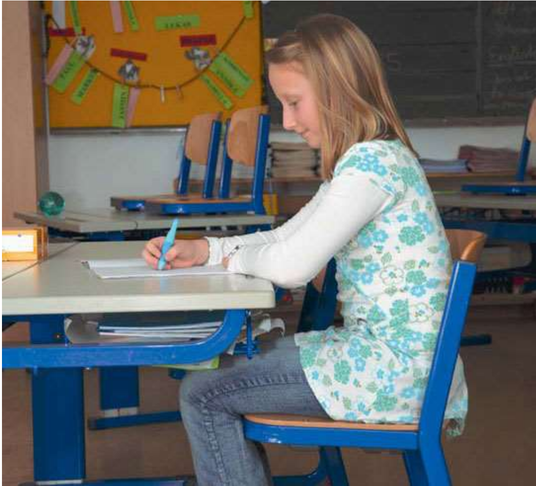
Pravilen sedeči položaj