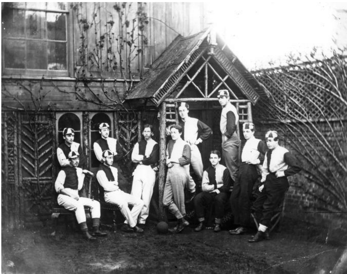
Nogometaši v Etonu so na enajsterico prisegli že pred več kot 150 leti.

Število igralcev se je tako med ekipami še razlikovalo. Večina jih je res za tekme uporabljala 11 igralcev, nekateri, ki so še vedno zagovarjali neposredno povezanost z ragbijem, tudi po 15, nekatere nogometne ekipe so štete celo 18 igralcev. Postalo je jasno, da ljubitelji ragbija in nogometa tudi po novem pravilniku ne bodo kar tako dosegli kompromisa, zato je bilo treba ukrepati.