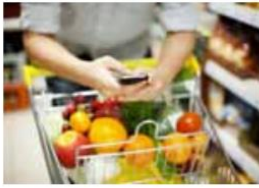
Marko gre v trgovino.