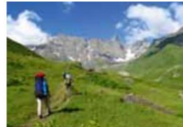
Špela in Janko