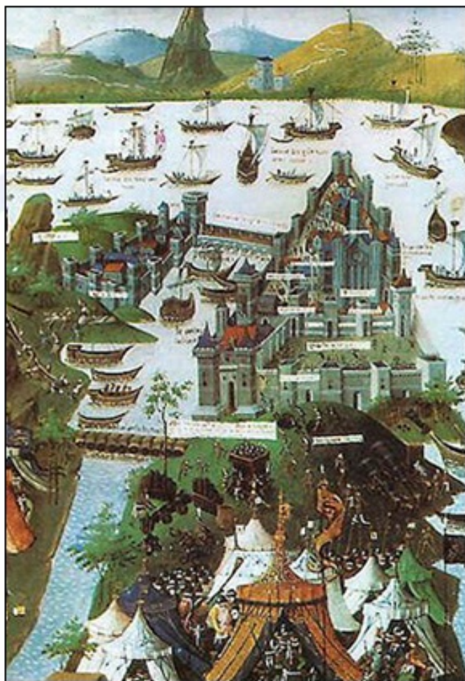
Obleganje Bizanca, upodobljeno na miniaturi iz 15. stoletja

Po turški osvojitvi Konstantinopla in padcu Bizantinskega cesarstva, ki je tedaj veljalo za center grške učenosti, so številni grški misleci, filozofi in učenjaki pred Turki zbežali v Italijo in na italijanskih tleh vzpodbujali nadaljnji razvoj humanističnih idej.