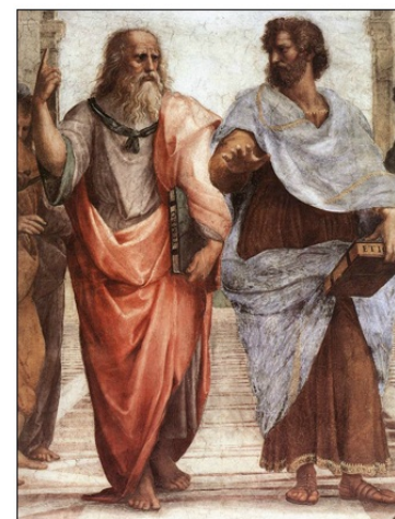
Velika antična misleca Aristotel in Platon

Izobraženci so se pod vplivom ANTIČNIH DEL pričeli zanimati za človeka in njegovo življenje na tem svetu, kar je povečalo potrebo po razvoju šolstva in pospešilo razvoj modernih znanosti .