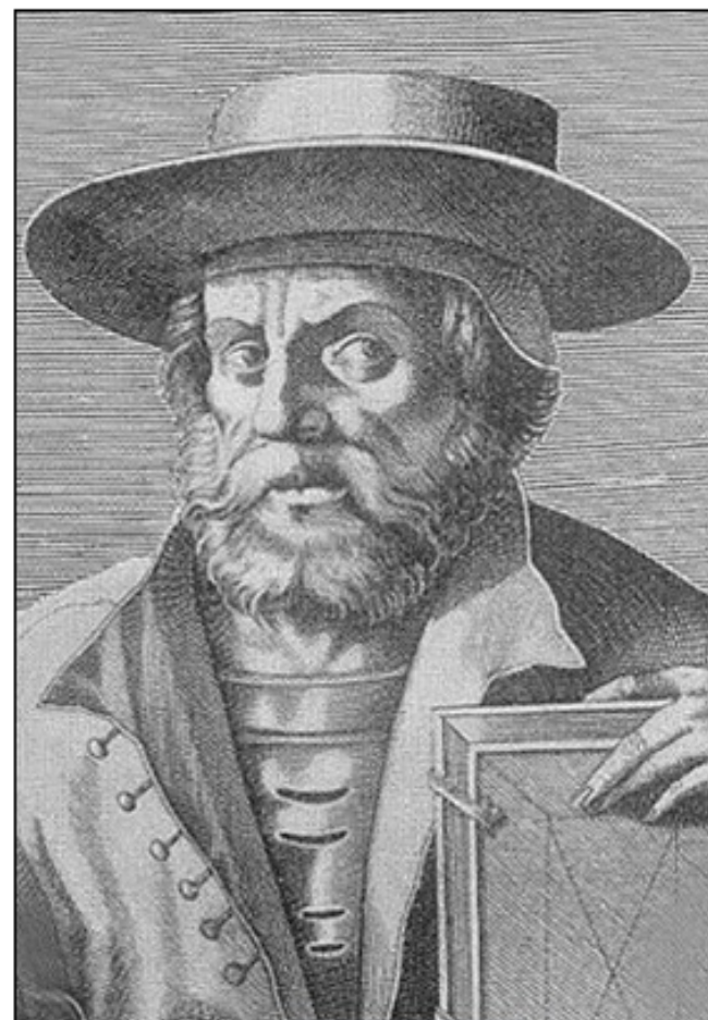
V Konstantinoplu rojeni grški filozof Manuel Chrysoloras (ok. 1355 – 1415) velja za enega prvih, ki je zahodni Evropi predstavil grško literaturo in umetnost.