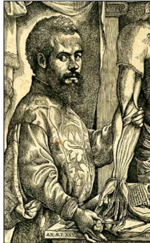
Andreas Vesalius (1514–1564)