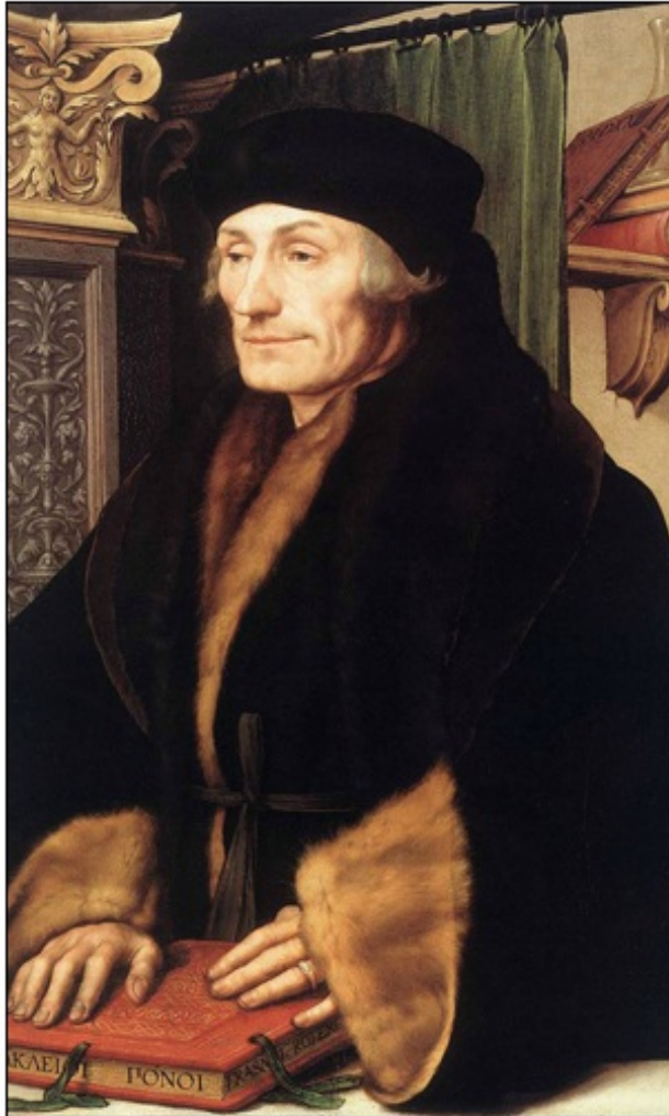
Desiderius Erasmus Roterodamus (1466-1536)