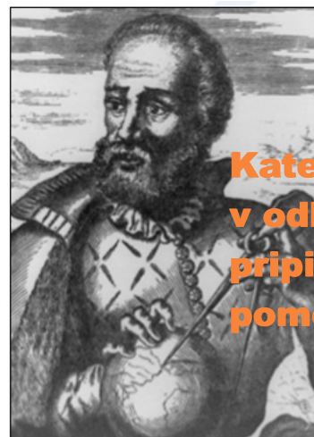
Španski pomorščak Ferdinand Magellan

Kateri dosežek v odkrivanju sveta pripisujemo temu pomorščaku?