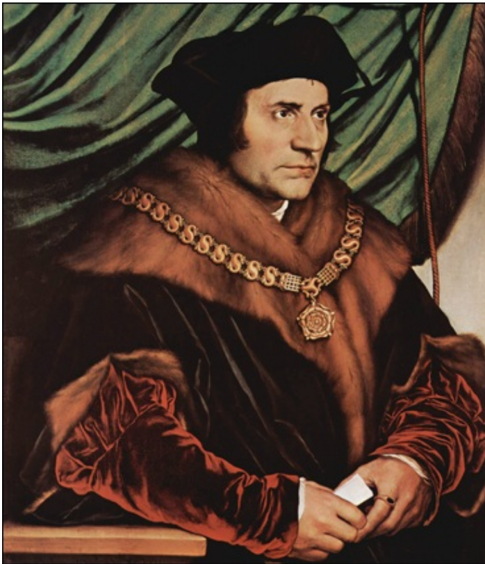
Portret Thomasa Mora iz leta 1527