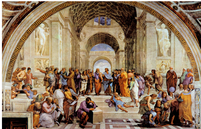
Rafael, Atenska šola

Tukaj gresta dva antična misleca, kakor si ju je predstavljal renesančni slikar Rafael, po katerima se zgledujejo filozofi iz obdobja, ki ga obravnavamo.