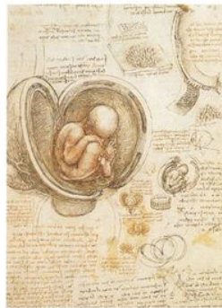
Skico zarodka v maternici je narisl Leonardo da Vinci

Tako kot astronomija je velikanski napredek doživela tudi medicina. Poznavanje človeškega telesa tem času je bilo minimalno. Ker je bilo seciranje trupel ali kakršnokoli podrobnejše proučevanje človeškega telesa strogo prepovedano, so redki posamezniki to opravljali na skrivaj. Eden takšnih je bil belgijski zdravnik Andreas Vesalius (1514–1564), ki je z raztelesenjem trupel in opazovanjem podrobneje spoznal človeško telo, svoje znanstvene izsledke pa leta 1543 predstavil v bogato ilustrirani knjigi O delovanju človeškega telesa . Anatomija in kirurgija sta bili v tistem času postranskega pomena, Vesalius pa je bil prepričan, da je temelje kirurgije potrebno poiskati v anatomiji in poudarjal pomembnost poznavanja človeškega telesa za razvoj medicine. Med drugim je ovrigel Galenovo teorijo, da imajo moški eno rebro manj od žensk in Aristotelovo teorijo, da je srce središče uma. Kljub temu, da Vesalius ni bil prvi, ki je svoje teorije utemeljeval na avtopsiji telesa, zaradi izjemno podrobnih in slikovitih opisov svojih spoznanj danes velja za prvega anatoma.