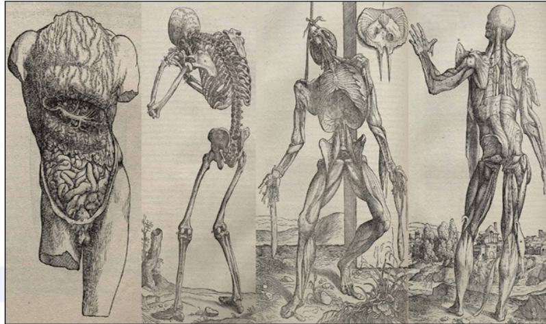
Vesaliusove skice so običajno v alegoričnih pobžajih

Tako kot astronomija je velikanski napredek doživela tudi medicina. Poznavanje človeškega telesa tem času je bilo minimalno. Ker je bilo seciranje trupel ali kakršnokoli podrobnejše proučevanje človeškega telesa strogo prepovedano, so redki posamezniki to opravljali na skrivaj. Eden takšnih je bil belgijski zdravnik Andreas Vesalius (1514–1564), ki je z raztelesenjem trupel in opazovanjem podrobneje spoznal človeško telo, svoje znanstvene izsledke pa leta 1543 predstavil v bogato ilustrirani knjigi O delovanju človeškega telesa . Anatomija in kirurgija sta bili v tistem času postranskega pomena, Vesalius pa je bil prepričan, da je temelje kirurgije potrebno poiskati v anatomiji in poudarjal pomembnost poznavanja človeškega telesa za razvoj medicine. Med drugim je ovrigel Galenovo teorijo, da imajo moški eno rebro manj od žensk in Aristotelovo teorijo, da je srce središče uma. Kljub temu, da Vesalius ni bil prvi, ki je svoje teorije utemeljeval na avtopsiji telesa, zaradi izjemno podrobnih in slikovitih opisov svojih spoznanj danes velja za prvega anatoma.