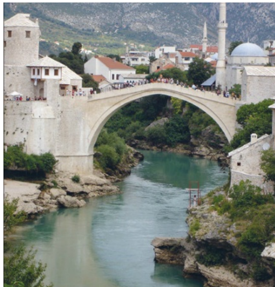
Veliko sledov Osmanskega imperija lahko najdemo v Bosni in Hercegovini. Na sliki je Mostar, katerega most je uvrščen na seznam Unescove svetovne kulturne dediščine. Most, ki je bil v zadnji vojni uničen, a nato obnovljen, so zgradili v 16. stoletju po načrtih znanega arhitekta Mimmara Hajrudina.

Veliko staroselcev balkanskih dežel se je odselilo na sever na ozemlje habsburške monarhije ali v Dalmacijo. V jugovzhodno Evropo pa so se priselili osmanski Turki.