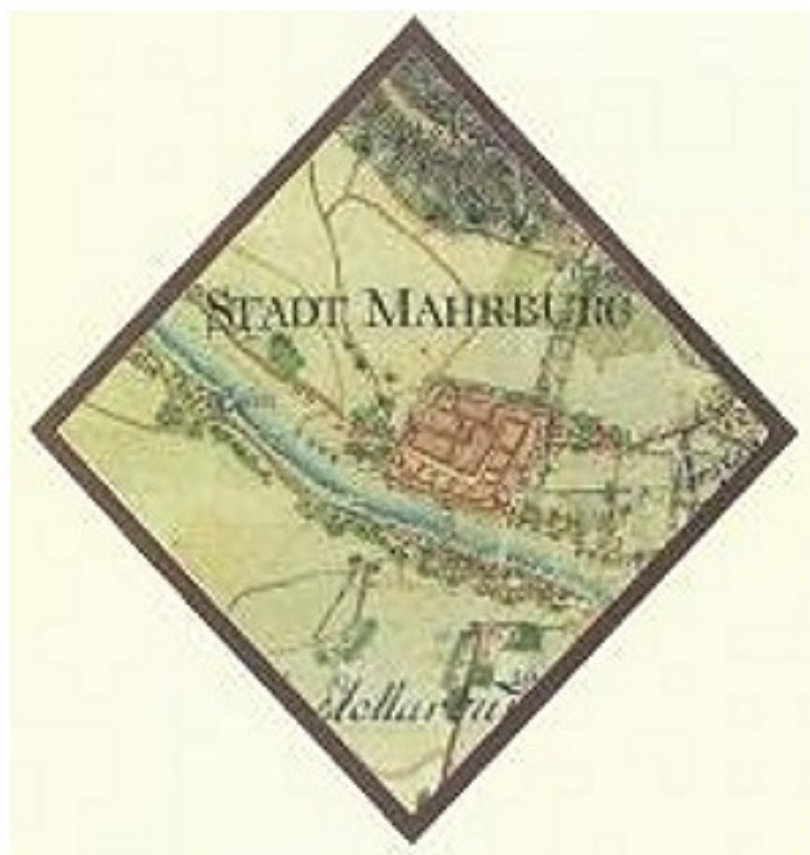
vojaški zemljevid Maribora (1764-1787)