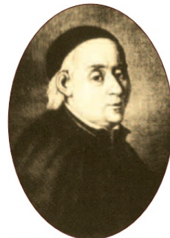
Gabrijel Gruber na sliki, ki jo hranijo v Arhivu Republike Slovenije (Orlov, 2002, 332; Orlov, 1995, 371)

Jezuit Gabrijel Gruber je projektiral rečni prekop Ljubljanice s katerim se je zmanjšala nevarnost poplav na Ljubljanskem barju in v Ljubljani.