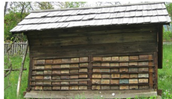
Janšev čebelnjak v Breznici

Anton Janša (1734 - 1773) velja za začetnika modernega čebelarstva in enega največjih poznavalcev čebel. Ovrigel je napačno prepričanje, da so troti vodonosi, trdil je, da je čebele koristno voditi na pašo, ter sklepal, da matico oplodijo v zraku. Panjem je spremenil obliko in velikost, kar je omogočilo zlaganje panjev v blok, pri slikanju panjskih končnic pa je pokazal tudi svoje slikarske sposobnosti. Na dunajskem dvoru je deloval kot učitelj čebelarstva ter po avstrijskih deželah predaval in ljudi poučeval o čebelarjenju. V nemškem jeziku je napisal dve knjigi o čebelarstvu: Razpravo o rojenju čebel in Popolni nauk o čebelarstvu , nauke katerih čebelarji upoštevajo še danes. Po njegovi smrti je Marija Terezija izdala odlok, po katerem so se vsi bodoči čebelarški učitelji pri usposabljanju morali učiti iz Janševih strokovnih knjig.