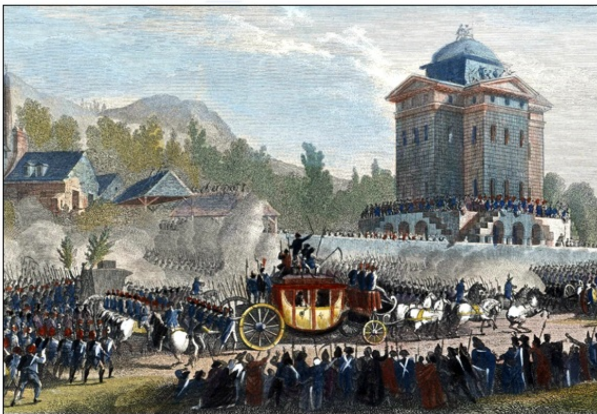
● Vrnitev kraljeve družine v Pariz 25. junija 1791

V noči iz 20. na 21. junij 1791 je kraljeva družina na skrivaj skušala pobegniti iz Pariza, a jih je revolucionarna vojska, kljub temu da so bili preoblečeni v oblačila služabnikov ruskih baronov, odkrila in vrnilav Pariz. Zaradi strahopetnega in izdajalskega pobega je kralj popolnoma izgubil ugled v vojski.