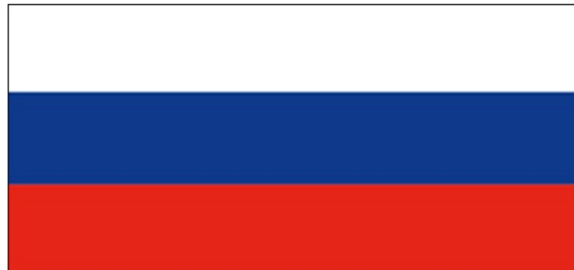
Belo-modro-rdeča zastava je eden izmed nacionalnih simbolov slovenskega naroda

V času marčne revolucije se je prvič uveljavila tudi slovenska narodna zastava. Slovenci so barve zastave najverjetneje določili na podlagi barv iz grba dežele Kranjske, ki je tedaj veljala za srce slovenstva. Zastavo je leta 1848 potrdilo tudi avstrijsko notranje ministrstvo. Belo-modro-rdeča trobojnica je nemudoma osvojila srca Slovencev in zavihrala po vseh slovenskih deželah.