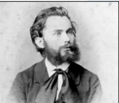
• Josip Stritar