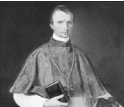
• Anton Martin Slomšek