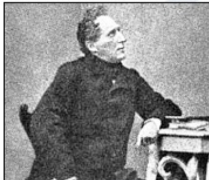
• Janez Bleiweis