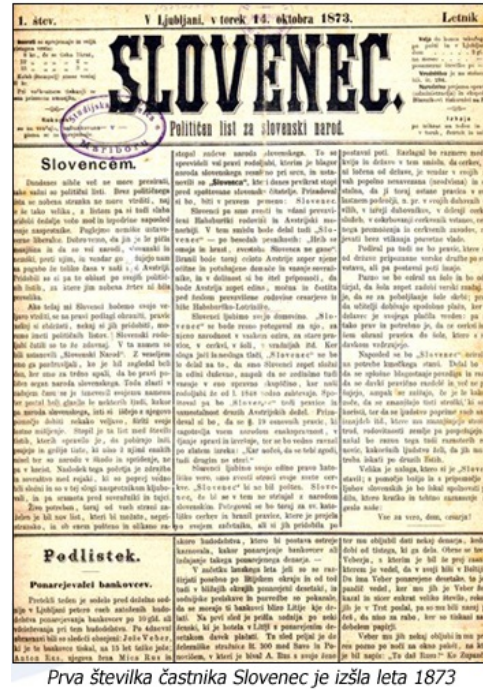
Prva številka častnika Slovenec je izšla leta 1873 Geslo staroslovencev: »Vse za vero, dom, cesarja!«