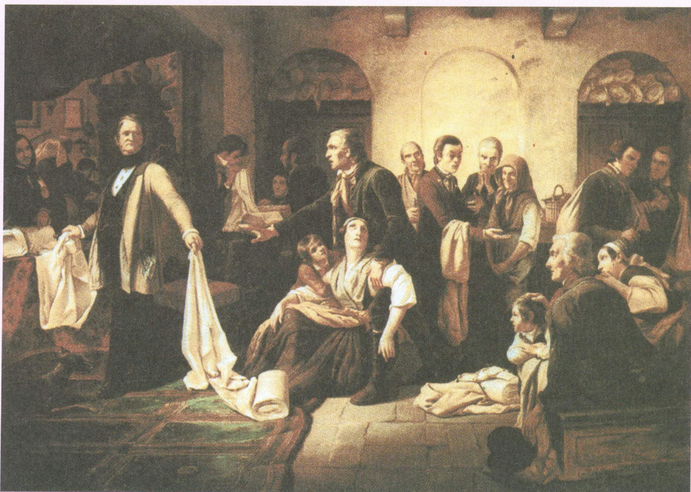
Šlezijski tkalci živijo na robu možnosti za preživetje – lakota in obup.