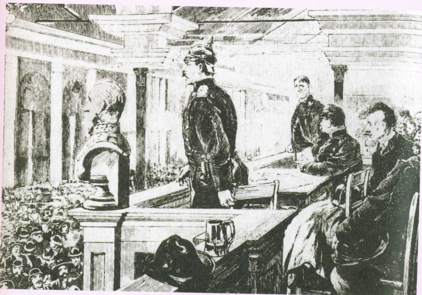
Pripadnik policije razpusti zborovanje delavcev na podlagi izrednega zakona proti socialnim demokratom v Nemškem cesarstvu.

Kljub naporom organizaciji ni uspelo delavstva tesneje povezati (vodstvo ni bilo enotno, različne struje so zagovarjale različne oblike vstaje). Leta