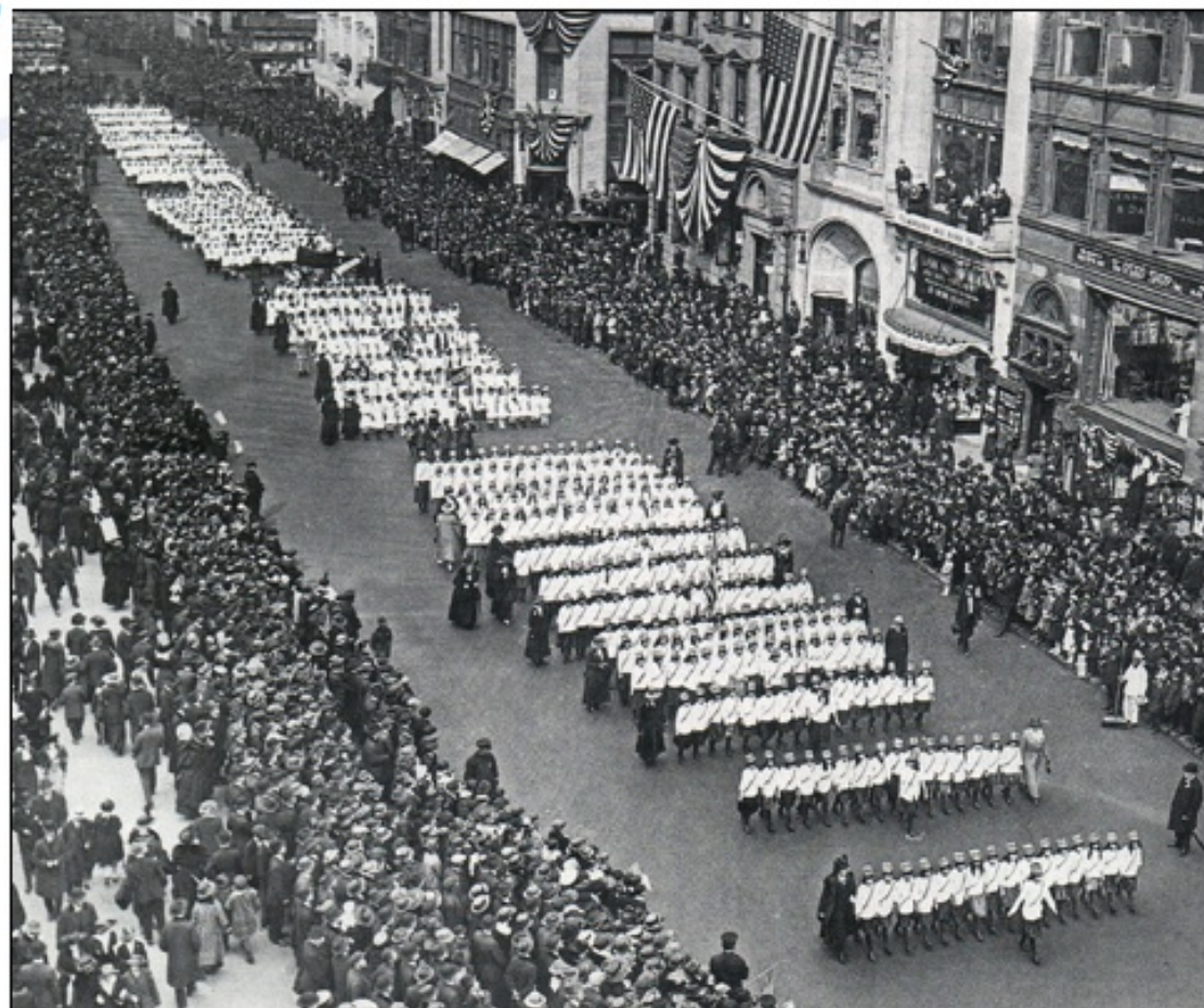
V ZDA proslavljajo vstop v vojno.

ZDA so pozvale Nemčijo, naj prekine s podmorniško vojno, ker pa ni bilo odziva, so 6. aprila Nemčiji napovedale vojno. V vojno so vstopile ravno v trenutku, ko so bili zavezniki v težki situaciji zaradi posledic podmorniške vojne in februarске revolucije v Rusiji. ZDA so reagirale takoj: že 19. maja so uvedli splošno vojaško obveznost, iz Velike Britanije in Francije je v ZDA prišlo 660 vojaških inštruktorjev, ki so urili ameriške vojake za evropska bojišča. Glavni problem ZDA je bila slabo razvita vojaška industrija, saj so večino orožja in vojaške opreme kupili v Veliki Britaniji in Franciji, v zameno pa so jim pošiljali surovine. Že kmalu po vstopu v vojno so ZDA začele prilagajati industrijo vojaškim potrebam. V juniju so na zahodno bojišče že prispeli prvi vojaki ameriškega ekspedicijskega korpusa, katerega moč je do konca leta narasla na okoli 100.000 vojakov.