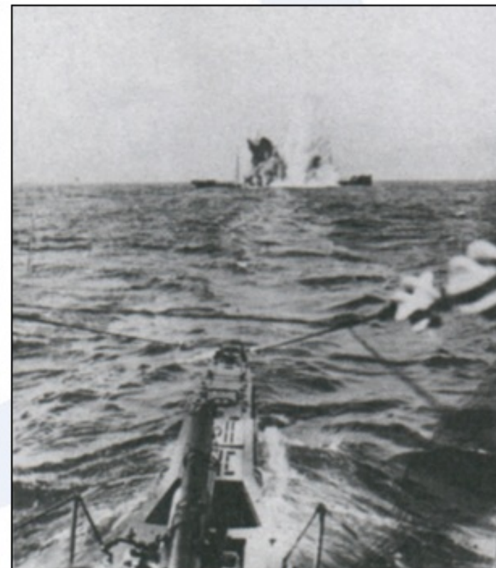
Poln zadetek nemškega torpeda.