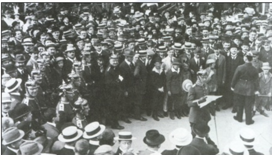
Objava mobilizacije v Nemčiji.

Ob začetku vojne so prebivalci držav udeleženk pozdravili začetek vojne. Notranja trenja v državah so zamrla, politične stranke pa so večinoma podprle odločitve državnikov glede vstopa v vojno. Med ljudmi se je okrepil nacionalizem, zavzemanje za mir pa je bilo označeno kot sramotno. Nihče izmed generalov ali državnikov, katerih države so bile vpletene v vojno, si ni znal predstavljati, kako dolgo bo vojna trajala, zato so svojim vojakom obljubljali, da bodo doma še pred zimo.