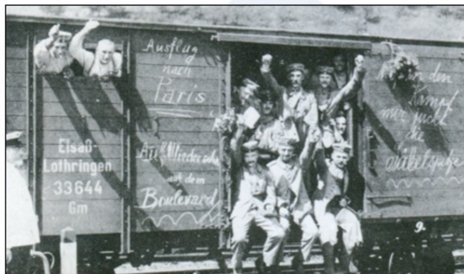
V začetku vojne gredo vojaki na fronto z navdušenjem.

Vojne napovedi in vstop v vojno so prebivalci (večina) vpletenih držav sprejeli z navdušenjem. Odziv na mobilizacijo je bil množičen. Veljalo je splošno prepričanje, da bo to kratkotrajna vojna.