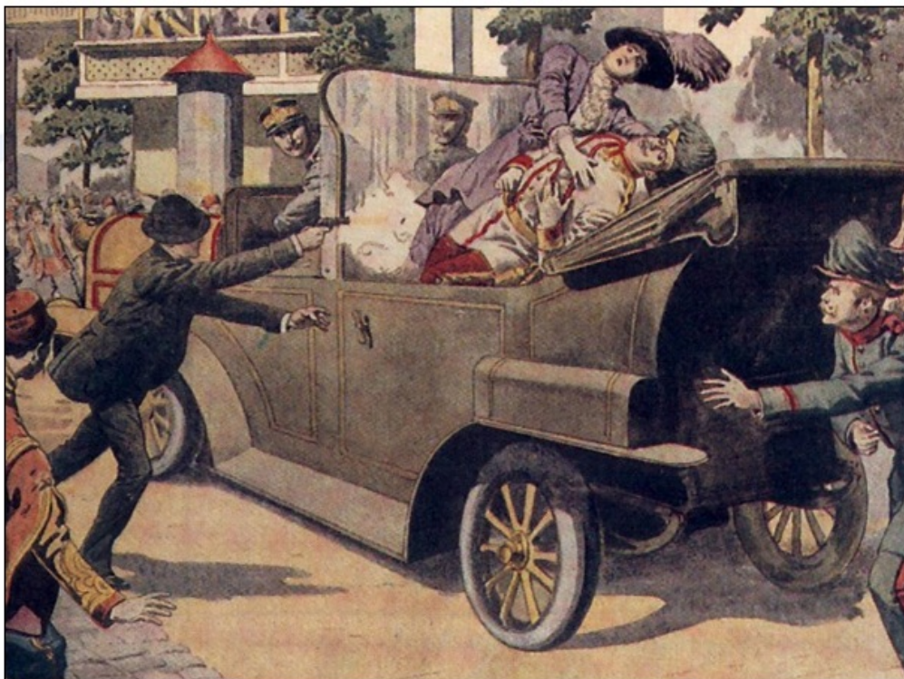
Slika atentata na avstro-ogrskega prestolonaslednika.

Ob koncu junija 1914 si je avstro-ogrski prestolonaslednik Franc Ferdinand s svojim spremstvom ogledoval vojaške manevre v Bosni in Hercegovini. Po končanih manevrih je na Vidov dan, 28. junija, obiskal Sarajevo. Priložnost za atentat je izkoristil Gavrilo Princip , član tajne narodno-revolucionarne organizacije Mlada Bosna in ustrelil prestolonaslednika in njegovo ženo Sofijo. Takoj po atentatu so ga ujeli in mu v času 12. do 23. oktobra 1914 sodili. Ker je bil Princip v času atentata mladoleten (star je bil 20 let, polnoletnost pa je bila takrat priznana z dopolnjenim enaindvajsetim letom), ga niso mogli obsoditi na smrt, ampak so ga obsodili na 20 let prisilnega dela. Zaprt je bil na Češkem, kjer je zaradi mučenj in naporov tudi kmalu umrl.