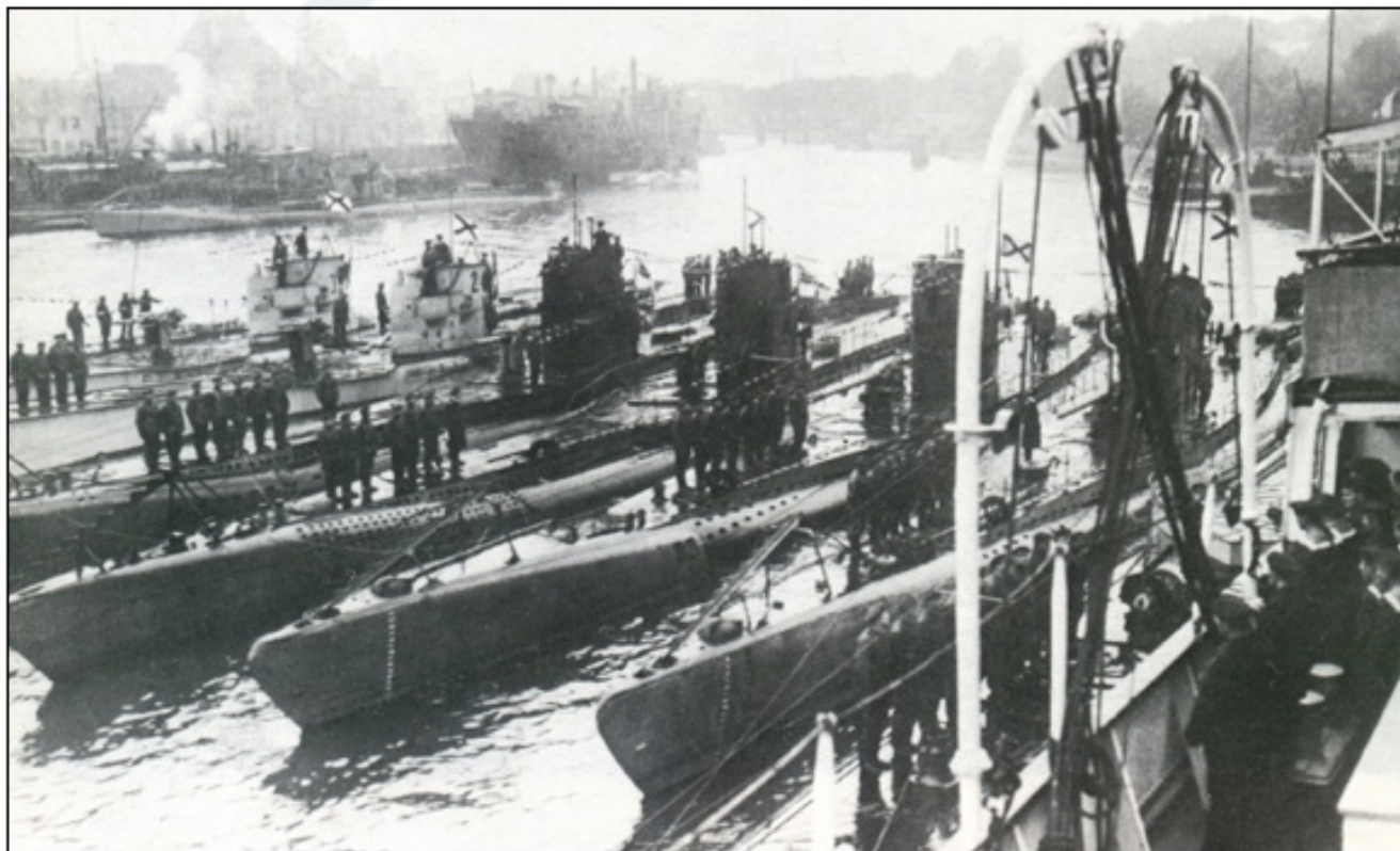
Nemške podmornice, zasidrane v matičnem pristanišču.

Neomejena podmorniška vojna po začetnih uspehih ni dala zelenih rezultatov. Z vstopom ZDA v vojno so bile izgube zaveznikov še manjše.