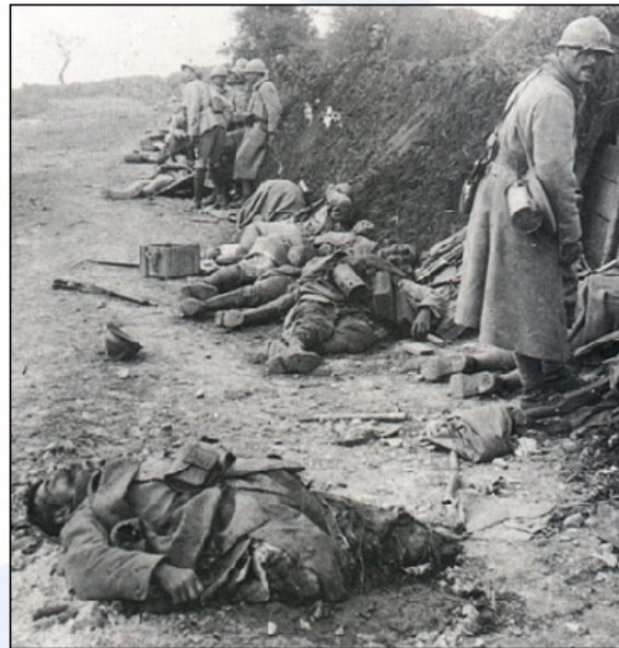
Eden izmed nešteti prizorov po bitki ...