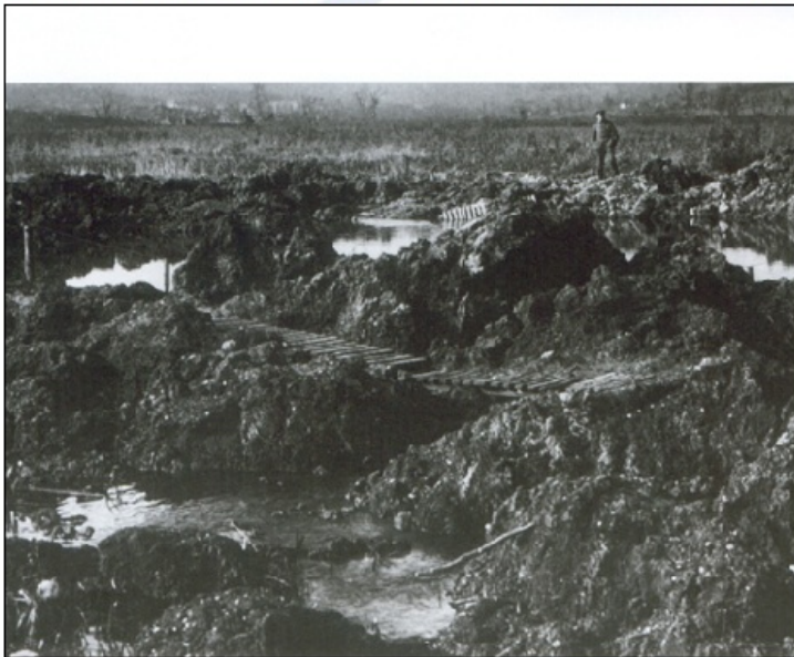
Francozi uspejo ubraniti Verdun, a cena je vsoka ... vasica Ornes po boju ...

V »verdunski klavnici«, kakor so imenovali ta 30 kilometrov širok in 10 kilometrov globok frontni odsek, so od februarja do decembra Francozi izgubili 378.000 mož (120.000 mrtvih), Nemci pa 337.000 (100.000 mrtvih). Na bojišče je padlo 21 milijonov nemških in 15 milijonov francoskih granat. Francozi so na bojišče pri Verdunu poslali kar dve tretjini celotne francoske vojske!