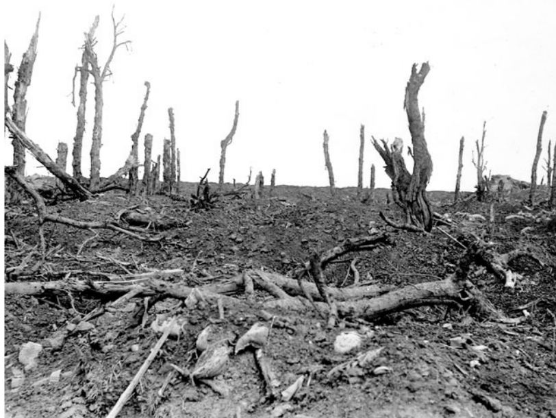
The main street of Pozières after the German bombardments of July–August 1916. Image 2 of 21