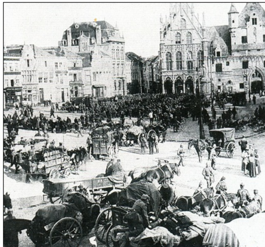
Sovražnik je v bližini mesta ? Civilno prebivalstvo v paniki zapušča svoje domove.

(Weber T. in Novak D., 1996, 20. stoletje v zgodovinskih virih, besedi in slikah, Ljubljana, DZS, str. 49)