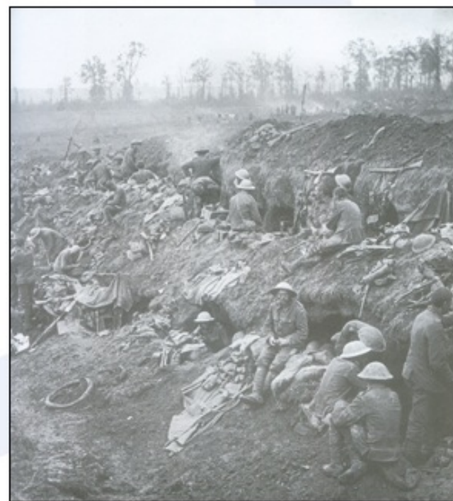
Med silovitim topniškim obstreljevanjem ...