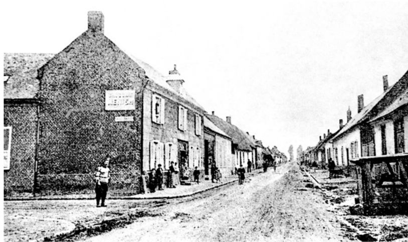
Main street, Pozières, August 1914. Image 1 of 21