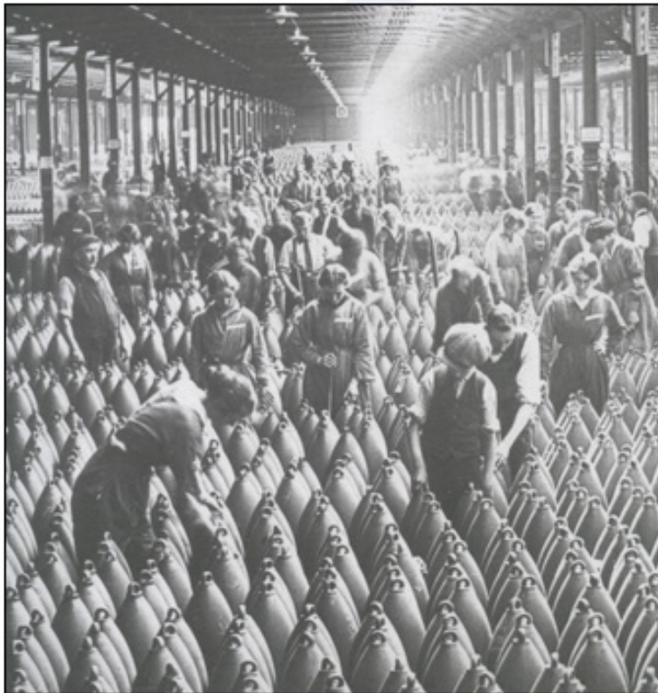
Obe vojskujoči se strani sta se na vojno pripravljali s pospešeno proizvodnjo vojaškega materiala.

Za državljane je veljala delovna obveznost.