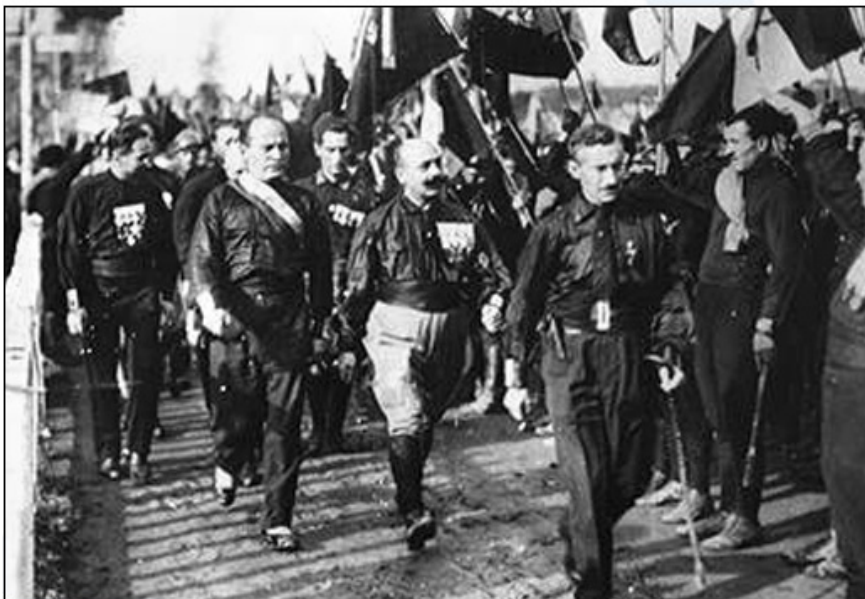
Mussolini in črnosraičniki med pohodom na Rim

Leta 1922 je izkoristil splošno stavko in s simboličnim pohodom na Rim od kralja izsilil mandat za sestavo vlade. Postal je predsednik vlade, čeprav so imeli fašisti v parlamentu le nekaj poslancev.