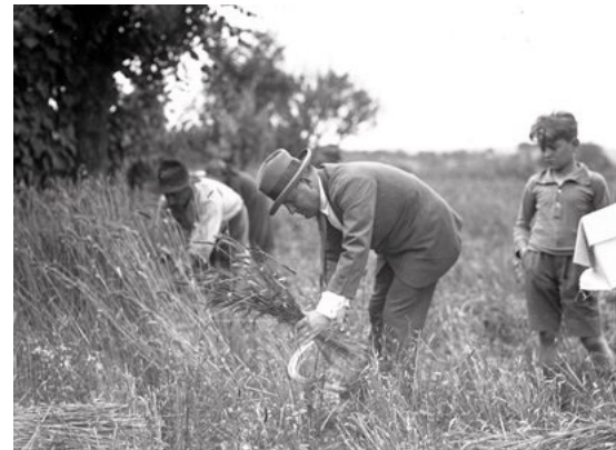
Mussolini na polju med kmeti žanje žito