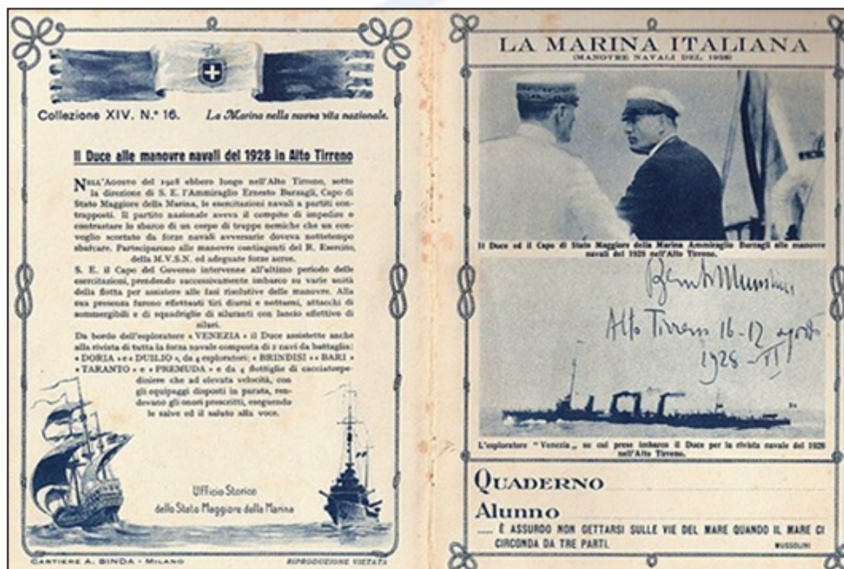
Fašistični propagandni časopis

Pomembno sredstvo pri utrjevanju fašističnega režima v Italiji je bila izjemno agresivna propaganda, ki je z vsemi tedanjimi propagandnimi sredstvi širila fašistično ideologijo. Ta je temeljila predvsem na poudarjanju žrtvovanja posameznika za italijansko državo, uveljavljanju, prizadevanju za blagor italijanske države in širjenju ozemlja ter moči Italije na račun drugih narodov in ki je povečevala Mussolinija ter njegovo popolno in nezmotljivo osebnost. Časopisi so pisali o uspehih italijanske politike, na plakatih so bila izpisana fašistična gesla, država je poskrbela za politične shode ter organizirala snemanje propagandnih filmov, radijski programi so predvajali fašistične govore, vse to pa je ustvarjalo kult Mussolinijeve osebnosti.