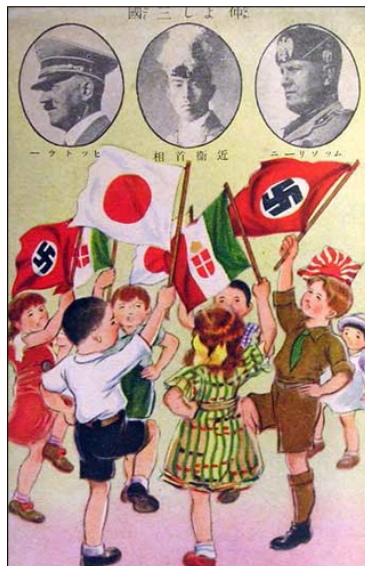
Japonski plakat za promocijo zavezništva med Japonsko, Nemčijo in Italijo