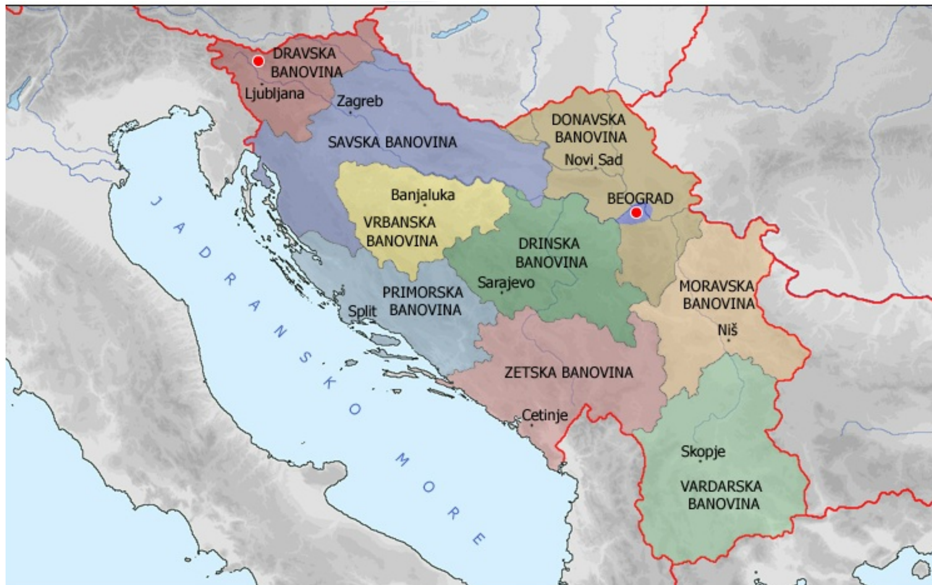
Jugoslovanske banovine z glavnimi mestimi