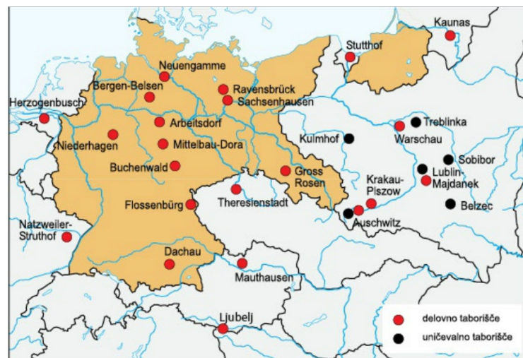
Zemljevid delovnih in uničevalnih taborišč