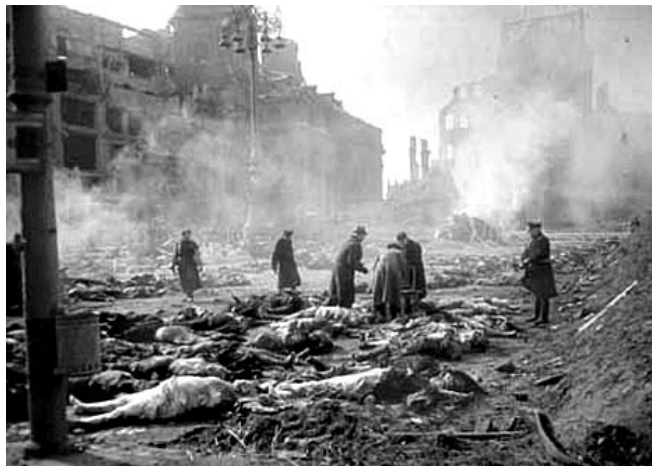
Dresden v Nemčiji po enem od silovitih bombardiranj zaveznikov.