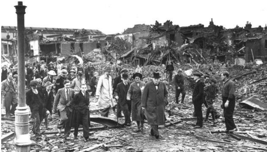
Predsednik Churchill si ogleduje posledice bombardiranja Londona.