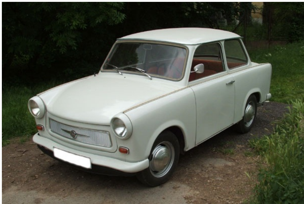
TRABANT - Vzhodna Nemčija