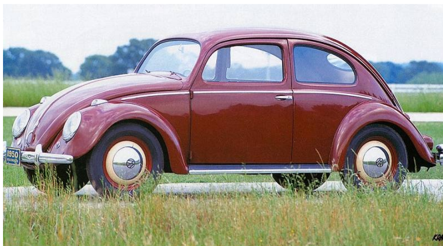
VOLKSWAGEN - Zahodna Nemčija

Oceni kvaliteto avtomobilov in sklepaj na kakovost življenja.