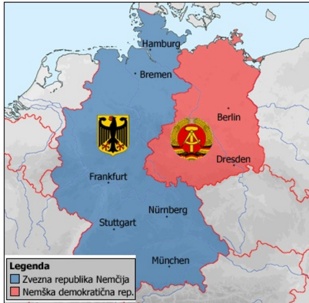
Nastanek Zvezne republike Nemčije in Nemške demokratične republike

Zahodni zavezniki so svoje tri cone povezali v skupno gospodarsko in politično enoto. Sovjetska zveza pa je v svojem delu uveljavila socialistično ureditev.