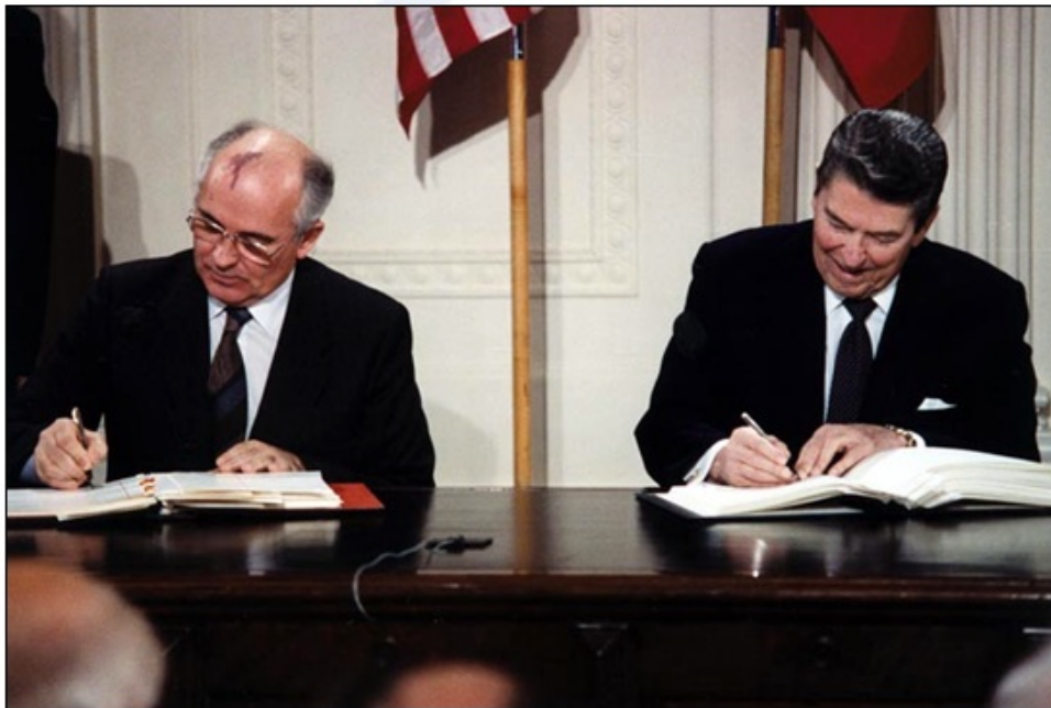
Gorbačov in Reagan v Beli hiši med podpisom sporazuma o uničenju jedrskega orožja

3. decembra 1989 sta Reaganov naslednik ameriški predsednik George H. W. Bush in sovjetski predsednik Mihail Gorbačov na srečanju na Malti na skupni tiskovni konferenci razglasila konec hladne vojne . Dve leti za tem sta nekdanja velika rivala skupaj nastopila v zalivski vojni proti Iraku.