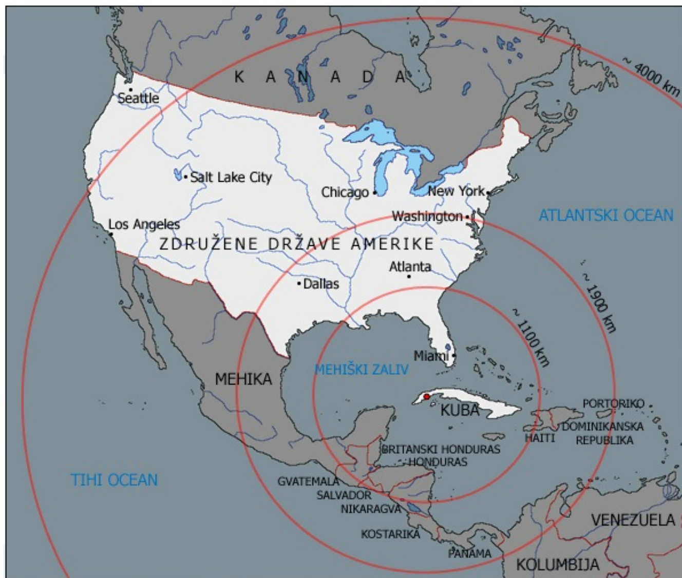
Zemljevid dometa sovjetskih raket med kubansko raketno krizo

Po ameriških gospodarskih ukrepih zoper Kubo in dogodkih v Prašičjem zalivu so se odnosi med sosedama močno zaostri. Kriza je dosegla vrhunec, ko so leta 1962 ameriška izvidniška letala odkrila, da Sovjeti na ozemlju Kube skrivoma gradijo svoja vojaška oporišča za rakete srednjega dometa, s katerimi bi lahko uničili večji del ameriškega ozemlja. Za preprečevanje nadaljnega dovažanja jedrskega orožja na Kubo je ameriški predsednik John F. Kennedy uvedel pomorsko blokado Kube. V ameriško pomorsko oporišče Guantanamo je poslal vojaške okrepitve ter od Sovjetske zvez in Kube zahteval, da nemudoma prenehajo z nameščanjem orožja in odstranijo raketna oporišča. Sovjete je opozoril, da bodo ZDA ob neupoštevanju zahtev vrnile udarec. S prvo direktno konfrontacijo SZ in ZDA od začetka hladne vojne se je svet znašel na pragu 3. svetovne vojne. Ob skrajno zaostrenih odnosih je sovjetski predsednik Nikita Hruščov popustil. Sovjetska zveza je obljubila, da bo iz Kube umaknila rakete srednjega dometa in odpoklicala vojaške ladje, ZDA pa, da ne bodo napadle sovjetskih ladij, da bodo sovje rakete umaknile iz Turčije in, da ne bodo skušale zrušiti Castrovega socialistična režima.