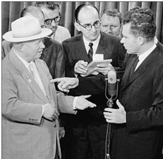
Nixon in Hruščov v Kremlinu leta 1959

Stalin je umrl leta 1953, nasledil ga je Nikita Hruščov. Leta 1959 sta si predsednika izmenjala meddržavniške obiske kar kaže na to, da je dialog med velesilama obstajal.