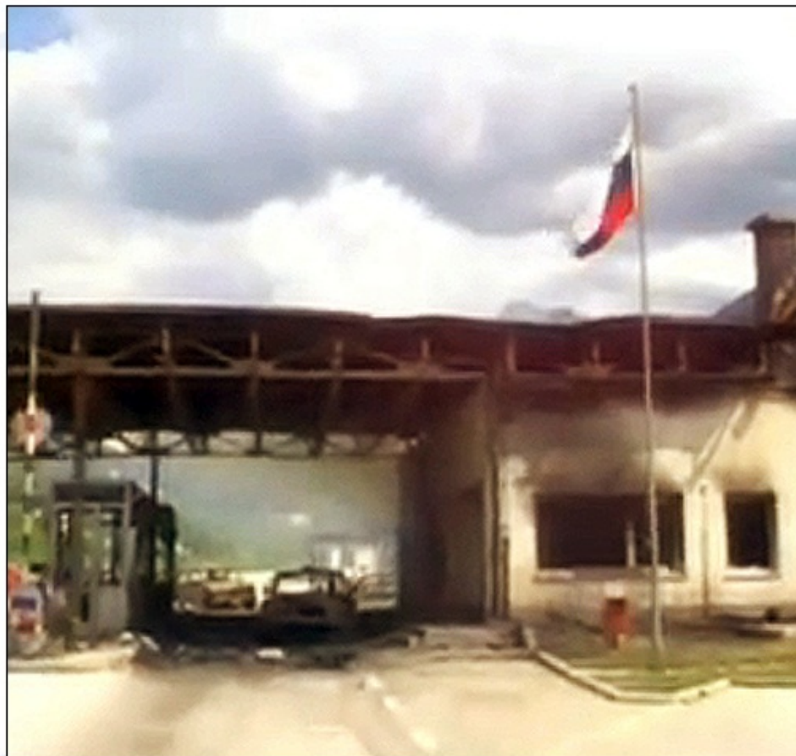
Na mejnem prehodu Holmec pride do enega največjih spopadov med osamosvojitveno vojno