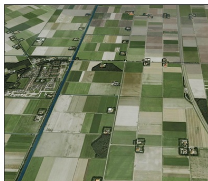
Na polderjih nastanejo prve zasebne in državne kmetije in ljudje pričnejo z obdelovanjem na novo pridobjenih površin.