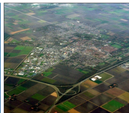
Kmetije se razvijejo v večja naseља, obdana z rodovitnimi obdelovalnimi površinami.