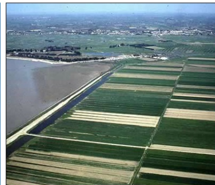
Na izsušenem ozemlju pridobijo nove obdelovalne površine, ki pa jih je potrebno pretvorti v rodovitne površine, saj je zemlja zaradi močne slanosti prsti nerodovitna. To naredijo delno z nanosi rodovtnejših prsti iz notranjosti države, delno pa s posebnim postopkom pridobivanja iz morskega mulja.