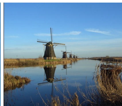
Ker padavinska voda s polderjev ne odteka, jo s kanalov dvigujejo s črpalkami na veter. Le okoli desetina naprav je resnično mlinov, ostalo so le strukture, ki prekrivajo črpalke.