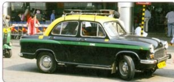
Indija je danes polna podobnih avtomobilov, ki so jih izdelovali predvsem za nezahteven domači trg.

Največji del prebivalstva Indijske podceline se še vedno preživlja s kmetijstvom, ki je močno odvisno od namakanja. Zato so glavna kmetijska območja ob rekah. Nekateri zahodni in južni deli Indije se razvijajo bistveno hitreje kot drugi, zato govorijo tudi o Indiji »dveh hitrosti«.