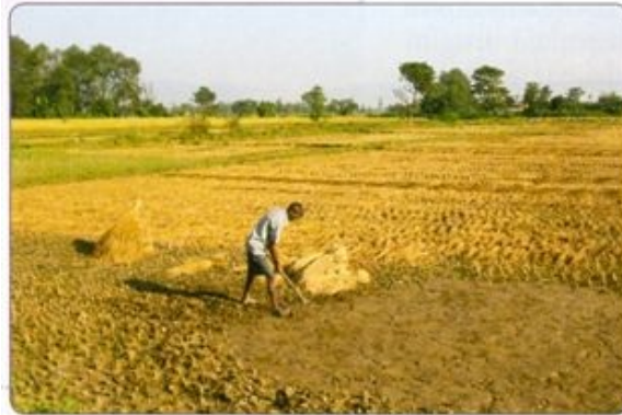
Obdelava polja na severu Indije