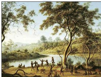
Aborigini, kot so jih upodobil prvi Evropejec, ki so pripluli v Avstralijo.

Man in Australia is an animal of prey. More ferocious than the lynx, the leopard, or hyena, he devours his own spicies.