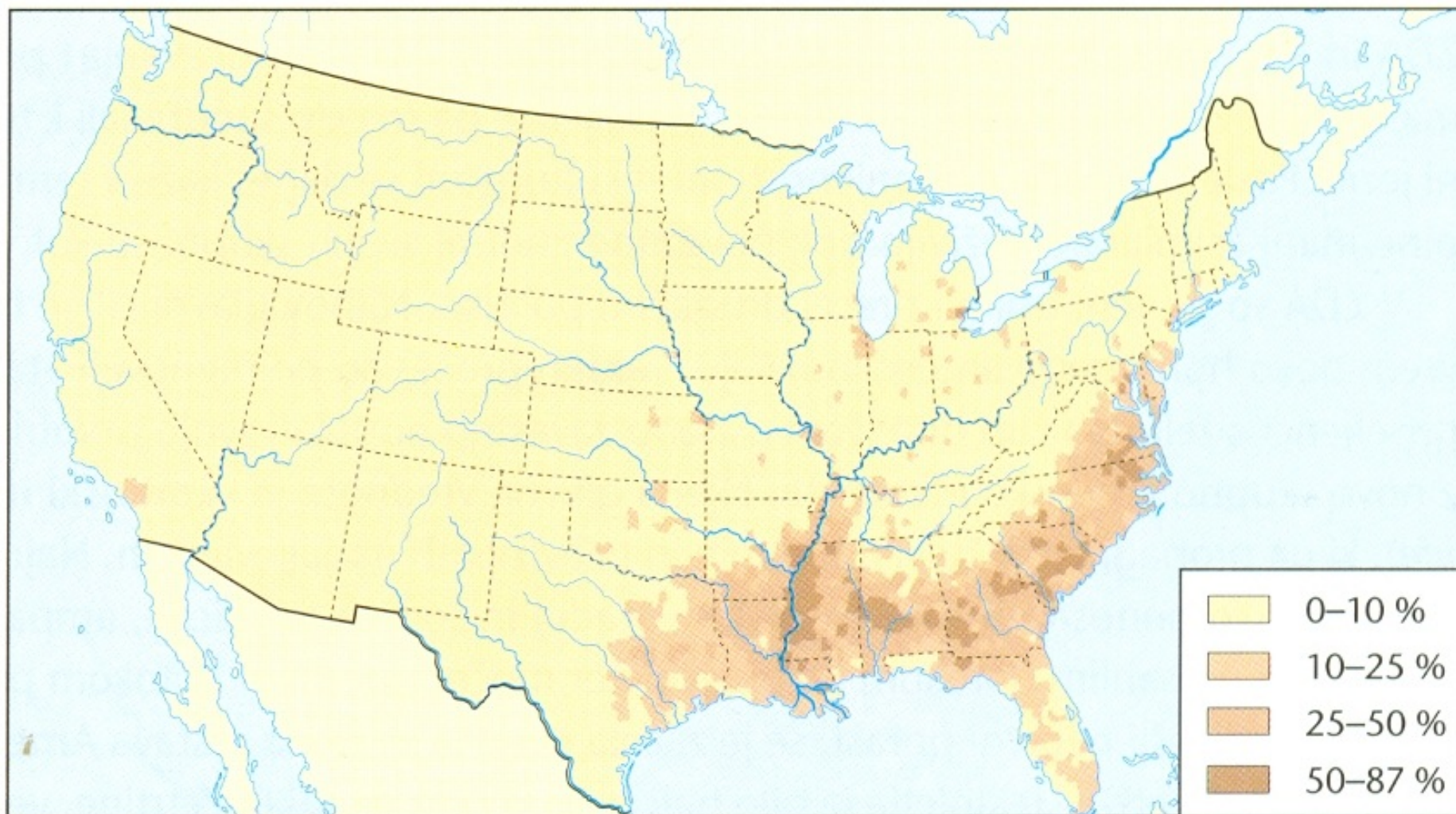
Prostorska razporeditev črnega prebivalstva v ZDA

Pojasni vzroke za obstoječo razporeditev črnega prebivalstva v ZDA