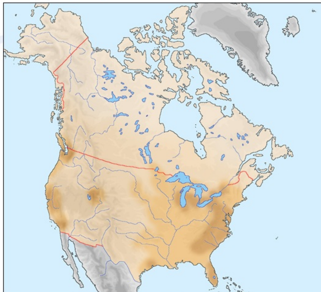
Zgostitvena območja prebivalstva Severne Amerike

Na zahodu sta dve večji območji zgotitve prebivalstva: prvo je južno od San Francisca do meje z Mehiko, drugo pa na meji ZDA in Kanade. V ozkem, za naselitev primernem pasu, so se mesta razvila predvsem ob obalah ali v dolinah rek. Prvotno prebivalstvo je pritegnilo predvsem zlato, kasneje pa se je tod razvila t.i. high-tech industrija, katere osnova so razvojni inštituti. Z razvojem prometne infrastrukture se je začelo tudi masovno preseljevanje prebivalstva iz prenaseljene vzhodne obale na zahodne obale, kjer je klima toplejša, okolje pa manj degradirano.