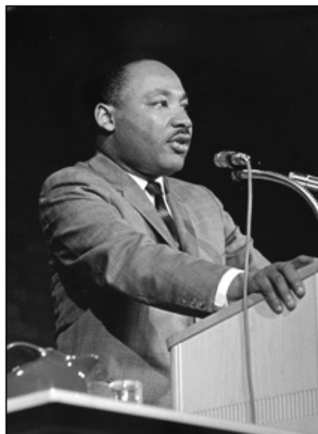
Borec za pravice črnega prebivalstva Martin Luther King (1929 - 1968)