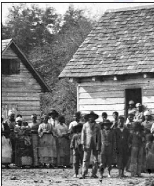
Suženjstvo je bilo v ZDA prepovedano šele po državljanski vojni, v letu 1865

Predvsem črno prebivalstvo je bilo zaradi zgodovine zmeraj zapostavljeno: čeprav je bilo suženjstvo odpravljeno leta 1862, so bili afroameričani obravnavani kot drugorazredni državljani. Kljub temu, da je bilo rasno razlikovanje z zakonom odpravljeno v 60-ih letih 20. stoletja, pa se socialne razlike med belim in črnim prebivalstvom še vedno kažejo v večjih mestih, kjer v getih živi predvsem črno prebivalstvo. V getih živi tudi veliko hispanoameričanov, vendar je problem manjši, saj ni obremenjenosti s preteklo suženjsko zgodovino in storjenimi krivicami.