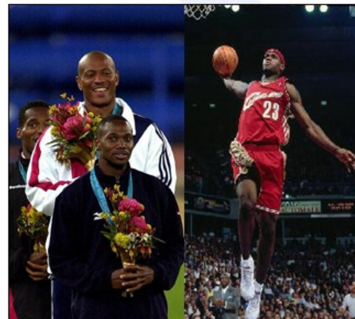
Črnci so zelo uspešni športniki (atletika na 100 m; košarka NBA)