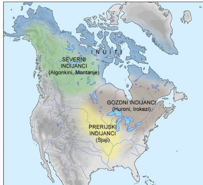
Največje skupine indijanskih plemen in njihova poselitvena območja pred prihodom Evropejcev

Preberi besedilo v učbeniku na strani 64 in odgovori na vprašanja.