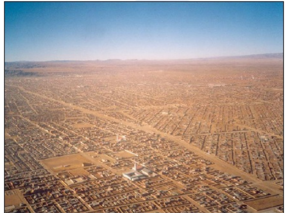
Barakarsko naselje v La Pazu