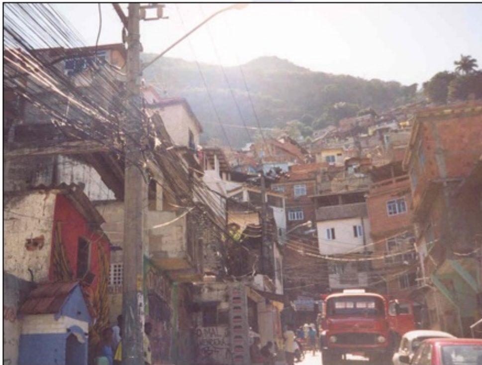
Neustrezno opremljena in neurejena favela (Rio de Janeiro)

Za Južno Ameriko je značilna zelo visoka stopnja urbanizacije, saj v povprečju živi v mestih okoli 75 % prebivalstva. Tako visok delež urbanizacije pa ni odraz razvitosti gospodarstva in velikega števila delovnih mest v mestih, ampak slabih razmer na podeželju, kjer so samooskrbne obdelovalne površine prenaseljene in se ljudje množično izseljujejo ter se poiskujejo zaposliti v mestih, kar jim pogosto ne uspe. Tako na obrobju mest nastajajo revne četrti, ki jih v Braziliji imenujejo favele . Označujejo jih gosta pozidava ter slabe higienske in socialne razmere.