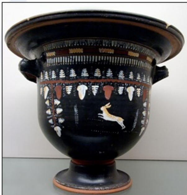
Posoda iz Apulije, 330 p.n.š.

Kolonizacija je začela potekati počasneje, ko so Grki pričeli posegati v prostor, ki je bil interesno območje drugih razvitih civilizacij in kultur. Na Bližnjem vzhodu so Grke najprej ovirali Asirci in kasneje Perzijci , v Severni Afriki Kartažani in v osrednjem delu Apeninskega polotoka Etruščani .