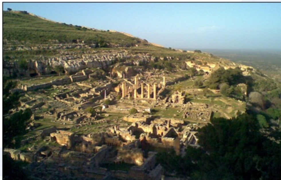
Ruševine Kiren (Libija)