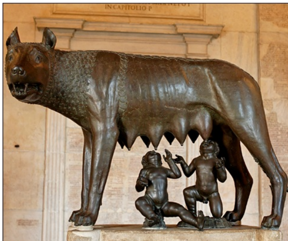
● Volkulja z Romulom in Remom predstavlja simbol Rima