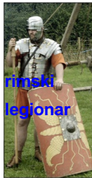
● Težko oborožen pešak

Večje vojaške enote so se imenovale LEGIJE, štejele so 4000 do 6000 mož.