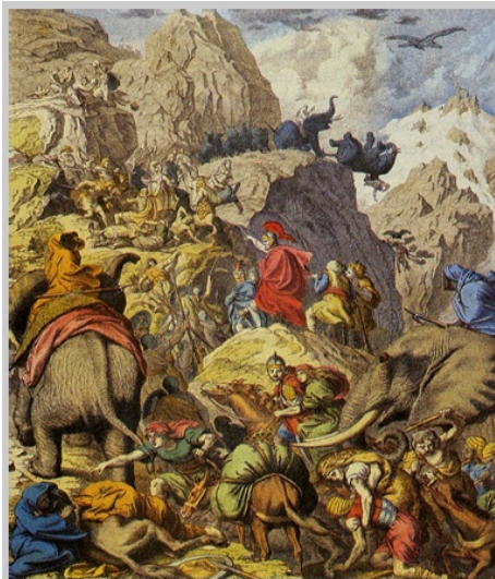
Zgodovinski pohod Hanibala s sloni prek Alp v drugi punski vojni

V drugi punski vojni kartažanski vojskovođa Hanibal z mogočno vojsko prečka Alpe in večkrat porazi rimsko vojsko. 16 let pustoši po Apeninskem polotoku