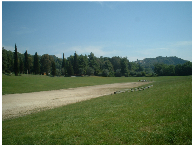
Stadion (tekmovališče) v Olimpiji