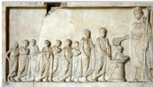
Skupina sedmih mlajših dečkov v spremstvu dveh bradatih mož, najbrž svečnikov, darujejo jagnje boginji, najverjetneje Demetri - boginji rodovitnosti, pridelka in letnih časov (marmorni relief, 4. st. p.n.š.)

Šolskih poslopij niso poznali, pouk je potekal v učiteljevi hiši ali na prostem. Šolarja je v šolo spremljal pedagog. Pedagog je bil suženj, ki je skrbel za vzgojo otroka. Učili so se branja, pisanja in računanja. Pisali so na voščene tablice. Veliko pozornost so namenjali športu, predvsem atletiki in glasbi. Not niso poznali, glasbeno lestvico so zapisovali s črkami.