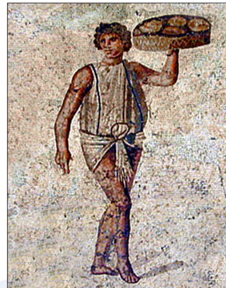
Mozaik prikazuje sužnja, ki streže na zabavi bogatašev

DRUGA SKUPINA SUŽNJEV SO BILI ZASEBNI SUŽNJI. TI SO BILI LAHKO POLJSKI SUŽNJI IN SO DELALI NA LATIFUNDIJAH. BOLJE SE JE GODILO HIŠNIM SUŽNJEV, KI SO OPRAVLJALI DELA POVEZANA Z GOSPODINSTVOM IN VZGOJO OTROK.