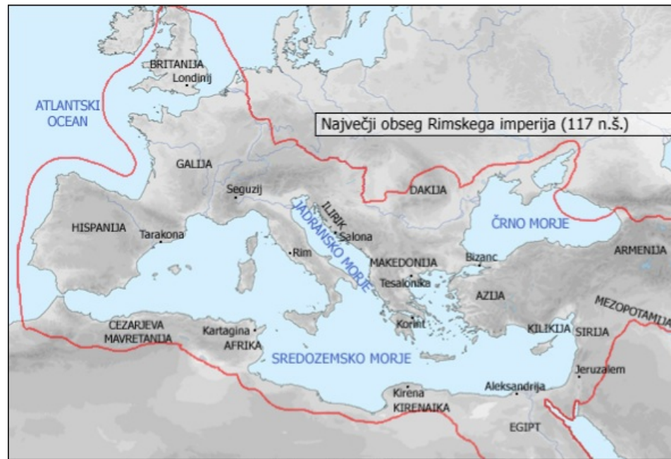
Rimski imperij na višku moči

Pomagaj si z zemljevidom v učbeniku na strani 56.