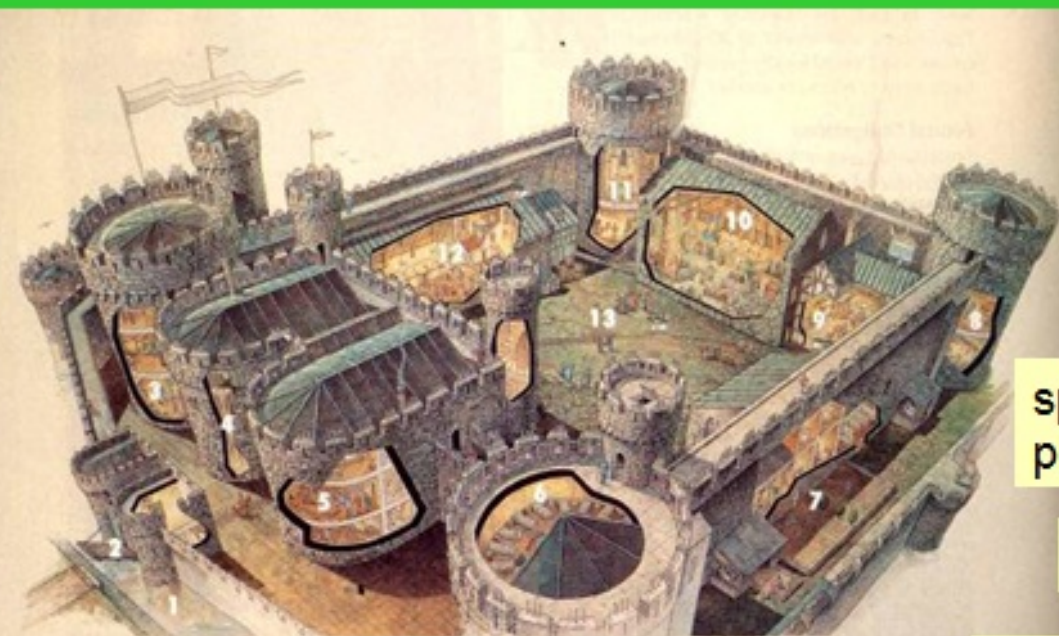
1-Moat; 2-Drawbridge; 3-Guardroom; 4-Latrine; 5-Armory; 6-Soldiers' quarters; 7-Kitchen garden; 8-Storerooms and servants' quarters; 9-Kitchen; 10-Great hall; 11-Chapel; 12-Sirel and lady's quarters; 13-Inner ward