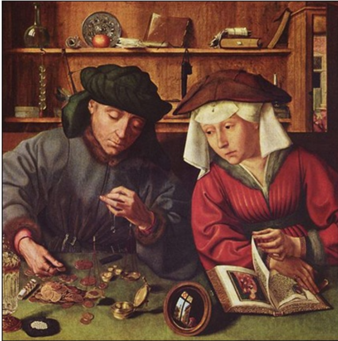
Bankir in njegova žena (slika flamskega slikarja Quentina Massysa, naslikana leta 1514).

Kdor koli, ki je imel opravka z denarjem se je kmalu znašel pred oviro. V obtoku je bilo veliko število različnih kovancev različnih vrednosti.