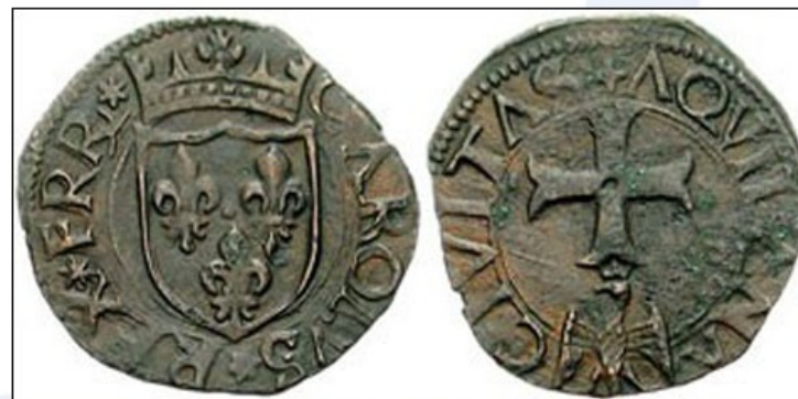
Neapeljski bronasti kovanec izdelan ob koncu 15. stoletja.

Vedno večja količina denarja v obtoku je omogočila prevlado blagovno-denarne menjave nad preprostejšo blagovno menjavo.