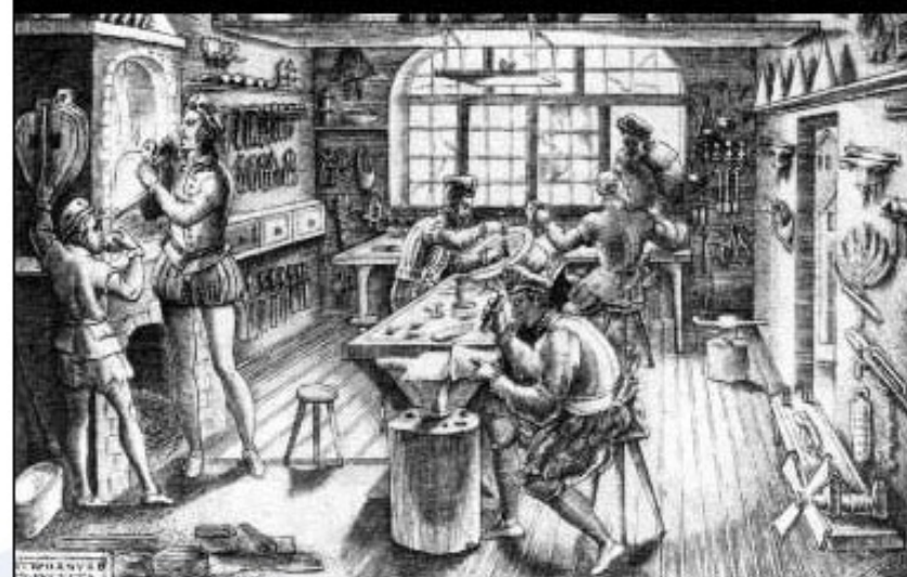
Delo v obrtniški delavnici.