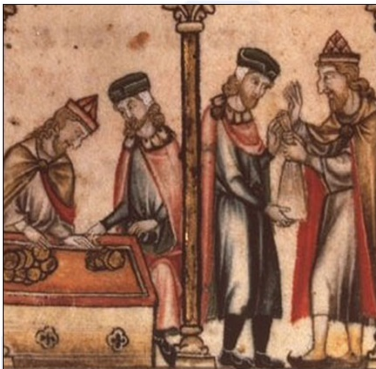
Židovski bankirji (upodobljeni z dolgimi kjukastimi nosovi) posojajo denar trgovcem.