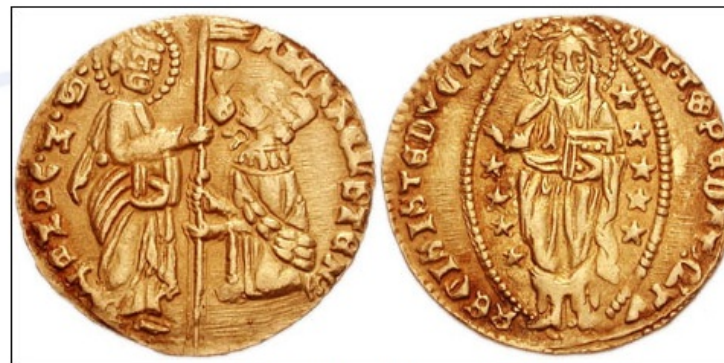
Beneški zlatnik izdelan ob koncu 14. stoletja.

V zgodnjem srednjem veku je bila pravica kovanja denarja privilegij vladarjev. Številni višji fevdalci in predstavniki cerkve so želeli pravico do kovanja svojega denarja, zaradi česar so jim vladarji dopustili izgradnjo svojih kovnic . Ko se je razmahnilo kovanje denarja, je prišlo v obtok veliko različnih novcev, ki so bili različne vrednosti. Zaradi tega so nekateri trgovci, predvsem Judi, odprli menjalnice , v katerih so tujim trgovcem ponujali zamenjavo tujih novcev za domače, s čimer so jim olajšali trgovanje (in tudi sami nekaj zaslužili z menjavo).