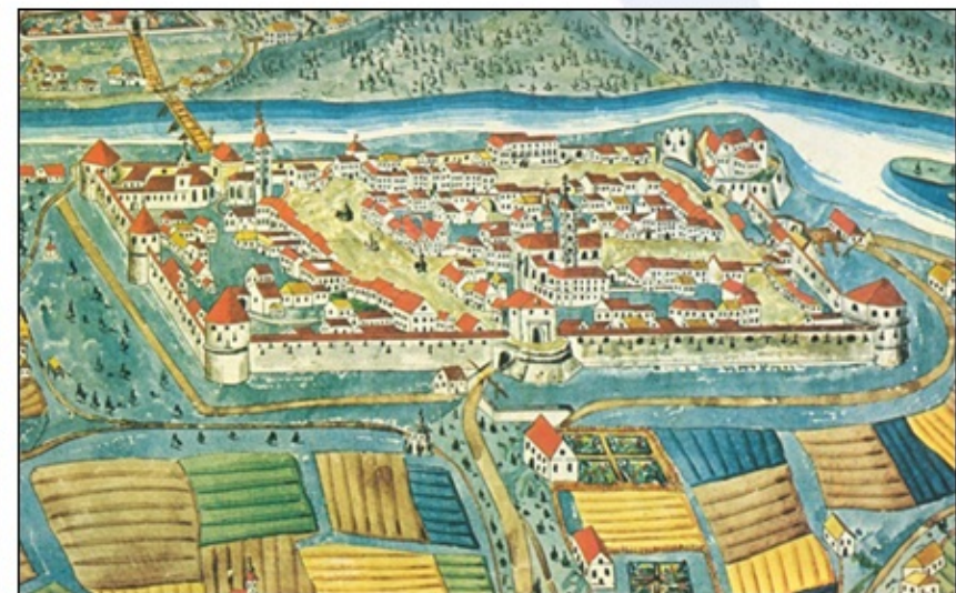
Upodobitev Celja na bakrorezu (1681).