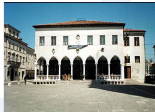
Loža nasproti pretorske palače v Kopru je bila zgrajena v 15. stoletju.

Poišči razlike v gospodarski usmerjenosti primorskih in celinskih mest.