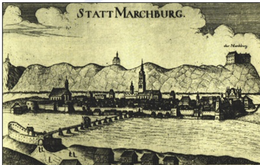
Upodobitev Maribora na bakrorezu (1681).

Celinska mesta so izvažala predvsem žito, živino, vino, med, vosek, kože, kožuhovino in les. Napomembnejše uvozno blago so predstavljali sol, južno sadje, sukno in steklo, med luksuznimi izdelki pa predvsem žlahtne kovine (zlato, srebro), dišave in svila.