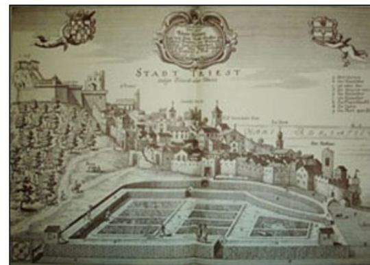
Upodobitev Trsta na bakrorezu Janeza Vajkarda Valvasorja (1689).

Prevladujoče dejavnosti teh mest jso bile sprva ribištvo, poljedelstvo, vinogradništvo in živinoreja. Z razvojem trgovine in obrti v 12. in 13. stoletju dobijo drugačno gospodarsko vlogo. S pospešenimi trgovskimi stiki so meščani začeli izvažati oljčno olje, vino, ribe in sol, uvažati pa žito in železo.