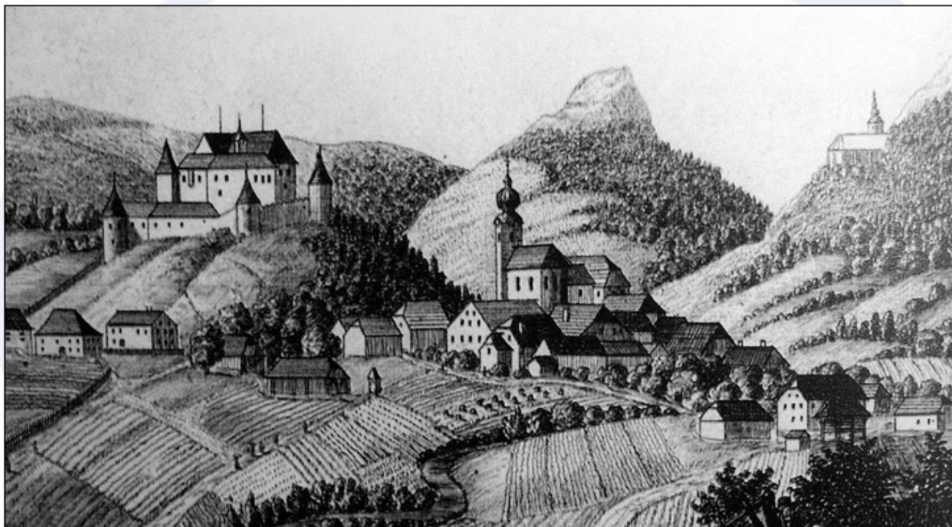
Slika tipičnega trga.

Na slovenskem ozemlju so prvi trgi začeli nastajati v 12. stoletju. Tržne pravice je podeljeval zemljiški gospod ali deželni vladar, ki je ob ustanovitvi dobil naziv trški gospod. Naziv trga so dobila naselja ob pomembnejših prometnih poteh, ki so imela možnosti za razvoj trgovine. Ob koncu srednjega veka je bilo na Slovenskem 70 naselij, ki so imela naziv trgi. Prebivalci trgov so bili osebno svobodni, imeli so pravico do letnih in tedenskih sejmov, pravico do lastnega pečata, ne pa tudi pravice do izgradnje obzidja (kar je bil privilegij mest). Trg je moral trškemu gospodu plačevati tržnino in mitnino. Veliko trgov se je sčasoma razvilo v mesta in pridobilo mestne pravice.