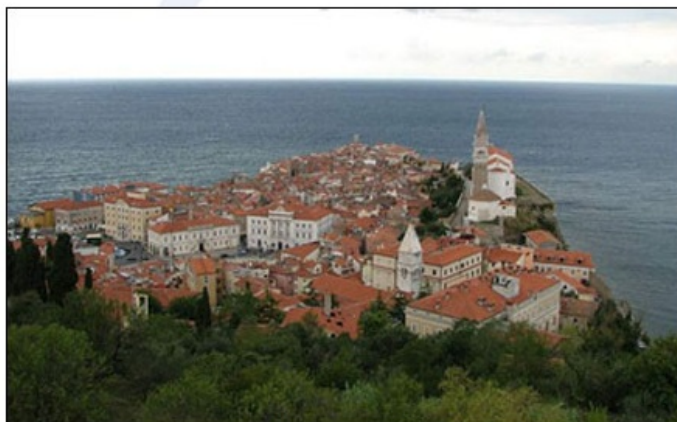
Piran ima lepo ohranjeno srednjeveško jedro.