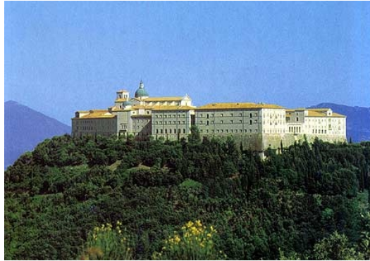
BENEDIKTINSKI SAMOSTAN MONTE CASSINO NAJ BI BIL NAJSTAREJŠI V EVROPI.

Najstarejši samostani v Evropi nastanejo v 6. stoletju, na ozemlju današnje Slovenije pa v 12. stoletju.