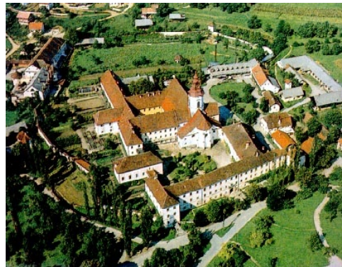
CISTERCIJANSKI SAMOSTAN STIČNA JE NAJSTAREJŠI SAMOSTAN V SLOVENIJI.

Najstarejši samostani v Evropi nastanejo v 6. stoletju, na ozemlju današnje Slovenije pa v 12. stoletju.