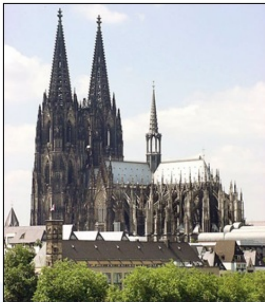
Mogočna kölnska katedrala, katere zvonika (dograjena sicer šele v 19. stoletju) merita v višino 157 metrov.