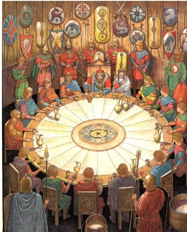
Kralj Artur in vitezi okrogle mize.