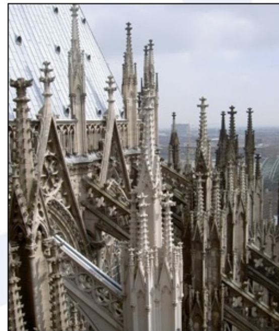
Oporni loki in številni stolpiči, ki poudarjajo višino, so značilen element gotskih gradenj.