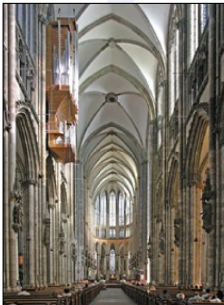
Notranjost mogočne gotske katedrale (Köln, Nemčija). Strop je 43 metrov nad tlemi.