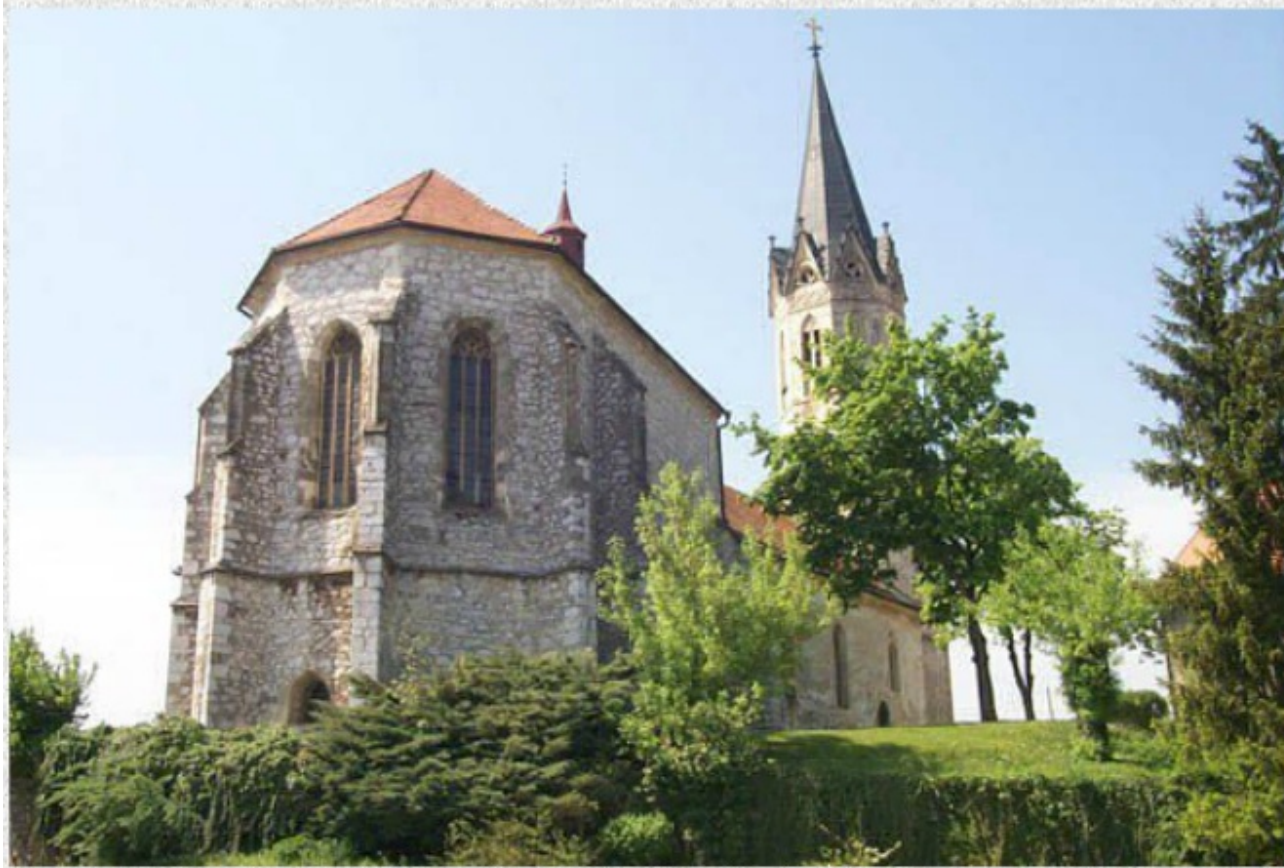
Kapiteljska cerkev sv. Nikolaja, Novo mesto, podaljšan prezbiterij (kor), pred letom 1429

Sredi 13. stoletja, ko je v arhitekturi prevladovala romanika, se je pojavil nov umetnostni slog – gotika. Širila se je predvsem po zaslugi menihov. Gotika je kot umetnostni slog prevladovala cela tri stoletja. V tem času je na slovenskih tleh nastalo na tisoče zgradb v gotskem slogu. Najbolj izrazito se izraža v arhitekturi podeželskih cerkva in župnijskih stolnic. Zanj je značilna uporaba obokanega oltarnega prostora. Sprva je prevladoval križni lok, nato pa zvezdasti in mrežasti lok. Kiparstvo se je močno razvilo, sprva kot del arhitekture, nato pa ločeno, še posebej v obliki kamnitih in lesenih oltarjev. Iz obdobja gotike se je ohranilo veliko stenskih slikarij, posebno fresk iz 15. stoletja.