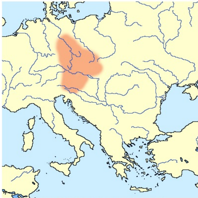
Približen obseg Samove plemenske zveze