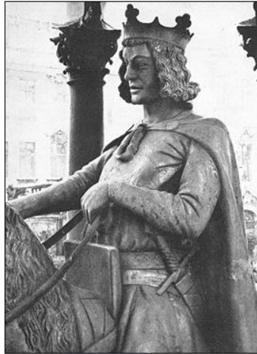
Oton I. Veliki (912 - 973), ustanovitelj rimsko-nemškega cesarstva.

Sredi 10. stoletja je državo pred Madžari obranil kralj Oton, ki ga je papež leta 962 okronal za cesarja Rimsko-nemškega cesarstva (Sveto Rimsko-nemško cesarstvo).