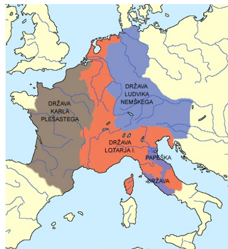
Razdelitev frankovske države po smrti Karla Velikega

Po smrti Karla Velikega je vzhodni del države dobil Ludvik Nemški